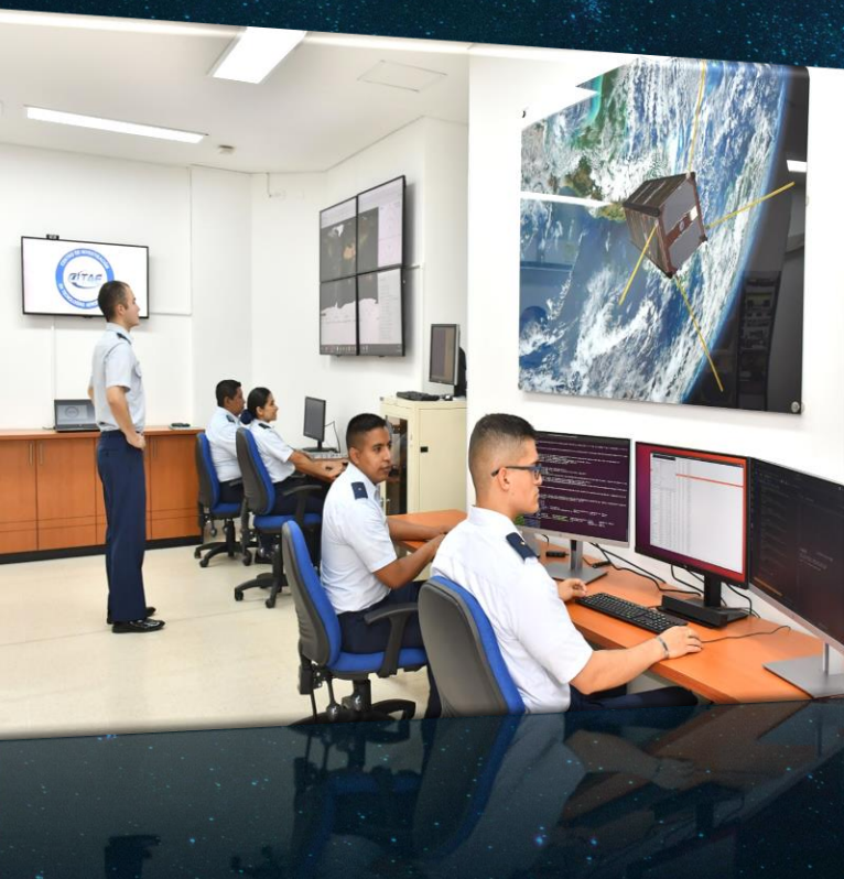
Estación terrena FACSAT-I Cali, Colombia.

Ejercer el contrapoder espacial mediante la explotación de activos espaciales para garantizar la libertad de acción en el espacio, con el fin de proteger los intereses nacionales.