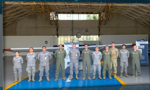
Visita Space Force y Space Command EEUU a la Escuela Militar de Aviación.

Se han realizado encuentros internacionales con Estados Unidos, Francia, Brasil, Perú, India, Argentina, entre otros; fortaleciendo la transferencia de conocimiento, el desarrollo de proyectos en conjunto y el intercambio de experiencias.