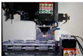
Centros de mecanizado y troqueladoras de perfiles. con perforaciones, troquelados y roscados en medidas especiales.