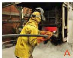
Fundición del aluminio en aleaciones de las series 1.000 y 6.000