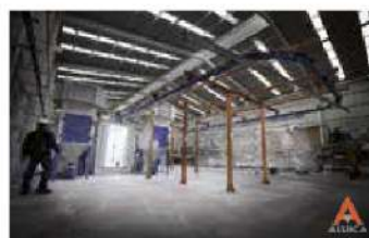
Acabados a través de pintura electrostática con un sistema de aplicación automática y continua.