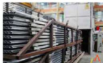
2 Hornos de envejecido para ajustar el Temple requerido