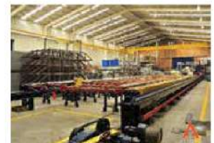
2 Prensas de extrusión directa.