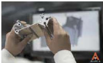
Diseño y asesoramiento técnico para la fabricación de nuevos desarrollos a la medida.