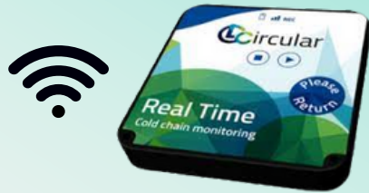
Datalogger CL Circular de tiempo real.

UNA SOLUCIÓN ASEQUIBLE, GRACIAS A NUESTRO MODELO DE ECONOMÍA CIRCULAR