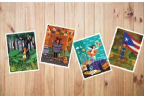
Set de 29 postales con las ilustraciones del libro Mujeres con todas las letra-z