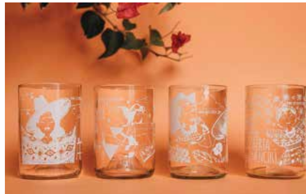
Juego de vasos reciclados realizados en alianza con la empresa Nos Vidrios con los diseños de las mujeres del libro Mujeres con todas las letra-z