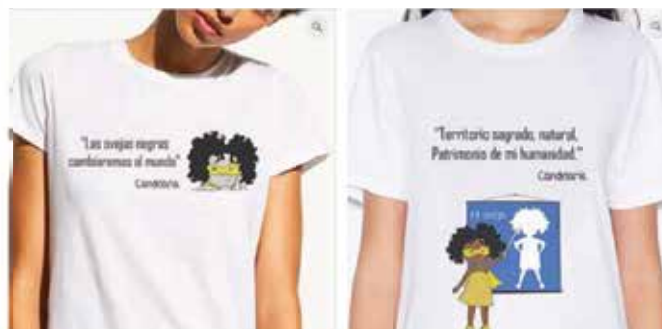
Camisetas con mensajes de Candelaria