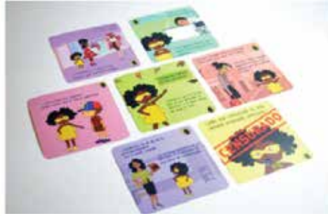
Juego de empatía utilizando los mensajes de Candelaria