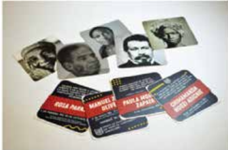
Juego de mesa: Descubriendo personalidades afro.

Los siguientes productos NO se encuentran a la venta. Hacen parte de las herramientas pedagógicas que tenemos disponibles.