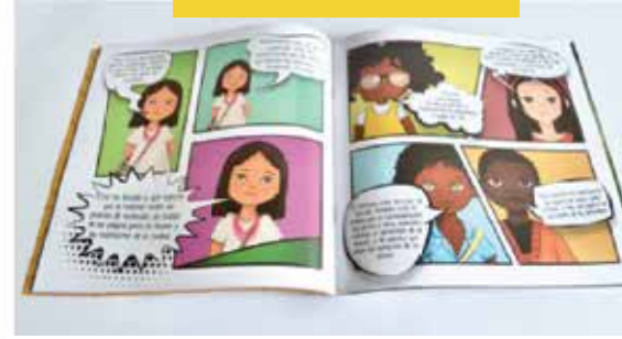
3 Cartillas de la Liga de la Diversidad, temáticas: Diversidad cultural, migración y diversidad femenina.