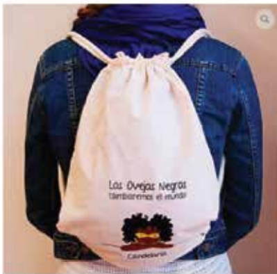
Mochila de Candelaria

Los siguientes productos se encuentran en venta y pueden convertirse en regalos para fechas especiales de tu organización.