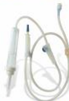
▲ SET PARA ADMINISTRACIÓN DE PLAQUETAS