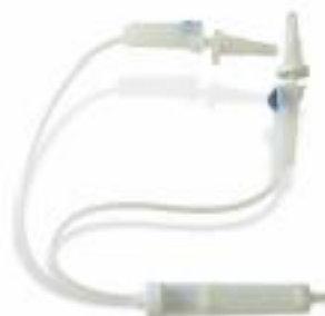
▲ SET PARA ADMINISTRACIÓN DE SANGRE EN "Y".