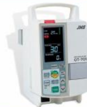
▲ VENTA Y APOYO TECNOLÓGICO