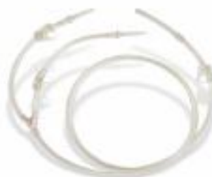
▲ EQUIPO EN "Y" PARA IRRIGACIÓN PLUS.