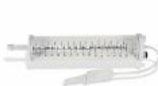
▲ BURETA DE 150 ml PARA CONEXIÓN EN LÍNEA.