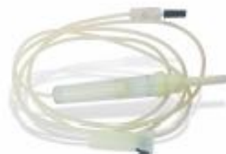
▲ SET PARA ADMINISTRACIÓN DE SANGRE.