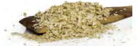
HOJUELA DE QUINOA