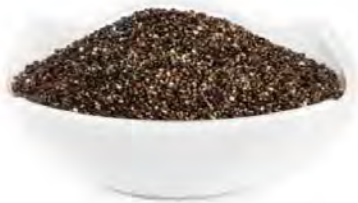
SEMILLA DE QUINOA ROJA