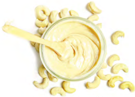
CREMA DE MARAÑÓN