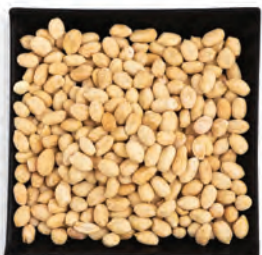
MANÍ TOSTADO ENTERO ARGENTINO/ BRASILEÑO/USA