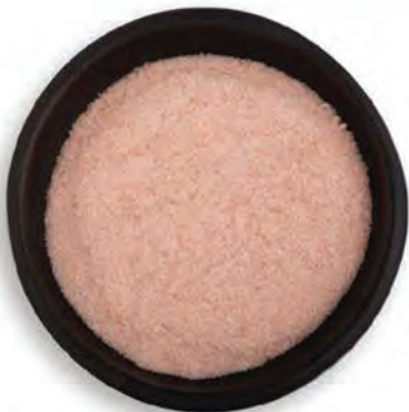
SAL ROSADA DEL HIMALAYA FINA