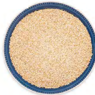
SEMILLA DE QUINOA EN PEPA