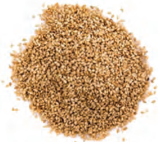
SEMILLA DE AJONJOLÍ TOSTADO