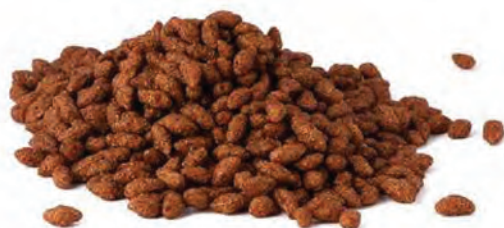
CEREAL EXTRUIDO ARROZ CHOCOLATE