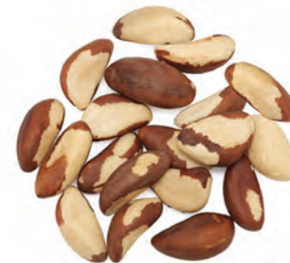
NUEZ DEL BRAZIL BROKEN- A,C,D.