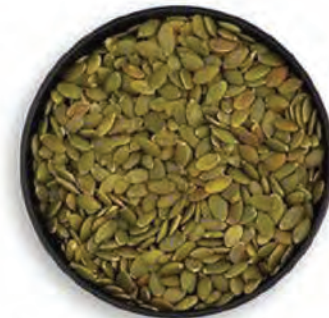
SEMILLA DE CALABAZA VERDE TOSTADA