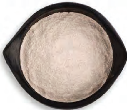
HARINA DE CENTENO