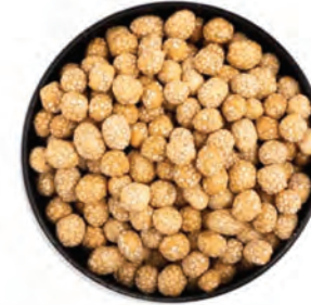
MANÍ CROCANTE CON AJONJOLÍ