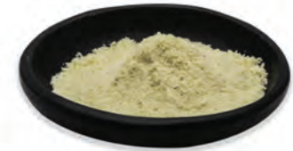
HARINA DE ALMENDRA