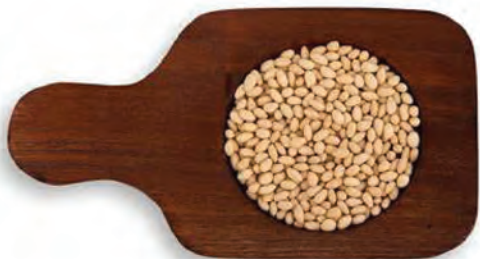
GIRASOL CROCANTE TIPO JAPONÉS