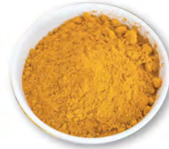
CÚRCUMA EN POLVO