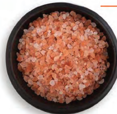
SAL ROSADA DEL HIMALAYA GRANULADA