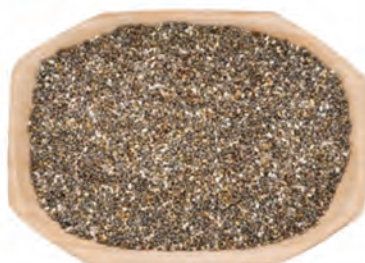
SEMILLA DE CHIA