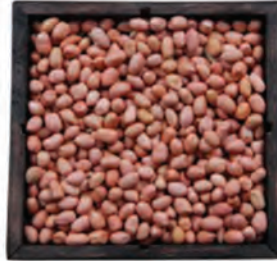
MANÍ CON PIEL JAVA INDIO