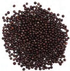
ESFERAS DE CEREAL