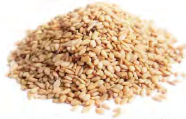
SEMILLA DE AJONJOLÍ DESCORTEZADO