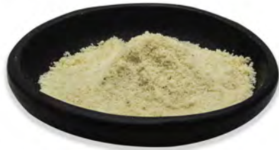
HARINA DE ALMENDRAS