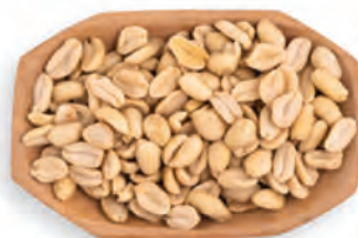
MANÍ PARTIDO SPLIT (PARTIDO A LA MITAD) ARGENTINO/ BRASILEÑO/USA