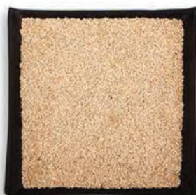
SEMILLA DE AMARANTO