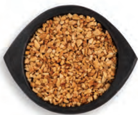
MANÍ TOSTADO TRITURADO ARGENTINO/ BRASILEÑO/USA