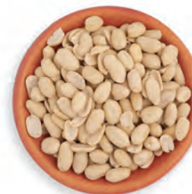
MANÍ BLANCHEADO CHINO