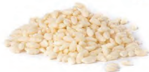
CEREAL EXTRUIDO ARROZ BLANCO