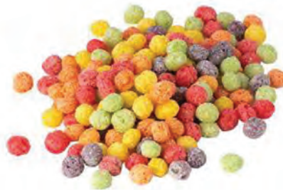
CEREAL EXTRUIDO BOLITAS FRUTALES