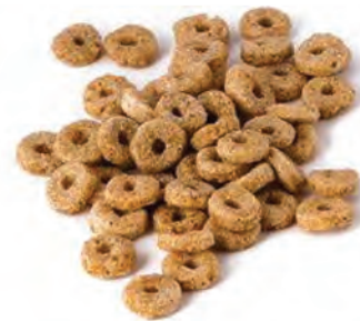
CEREAL EXTRUIDO QUINOA SABOR CANELA