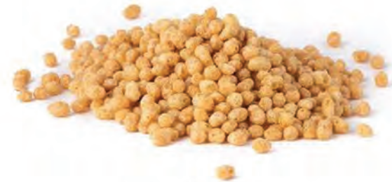
CEREAL EXTRUIDO MINI QUINOA