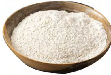
HARINA DE AVENA