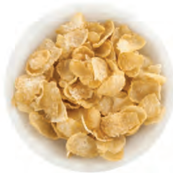
CEREAL HOJUELA NATURAL