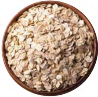
AVENA EN HOJUELAS