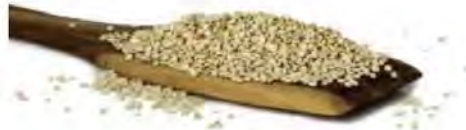
SEMILLA DE QUINOA BLANCA DESAPONIFICADA