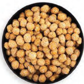
MANÍ CROCANTE RECUBIERTO DE AJONJOLÍ