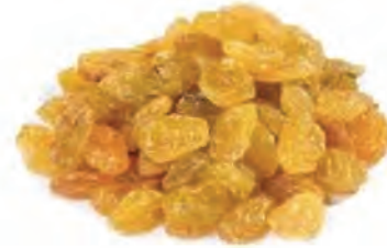
UVAS PASAS RUBIAS