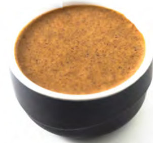
CREMA DE ALMENDRAS