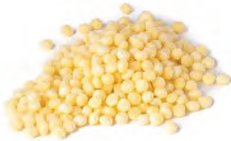
NUCLEOS PARA RECUBRIR