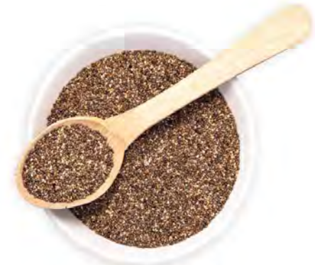
SEMILLA DE CHIA TIPO A