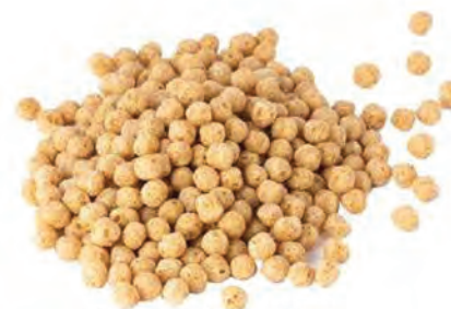
CEREAL EXTRUIDO DE QUINOA