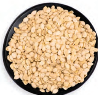
SEMILLA DE SANDÍA