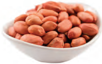
MANÍ CON PIEL BRASILEÑO / INDIO ARGENTINO