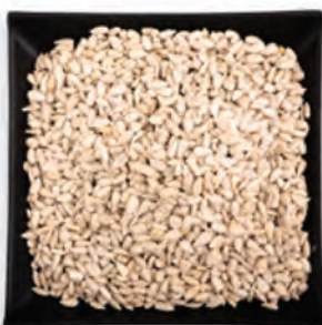
SEMILLA DE GIRASOL DESCORTEZADO