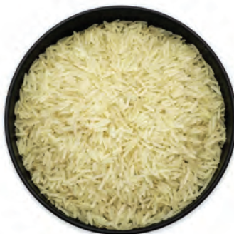
ARROZ BASMATI DE LA INDIA