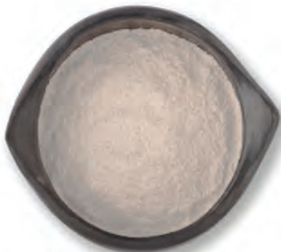
VITAL WHEAT GLUTEN