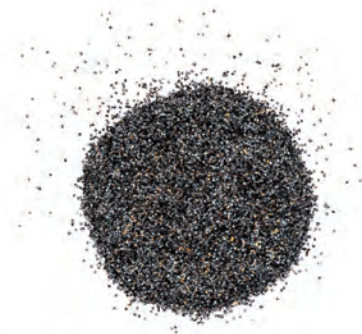
SEMILLA DE AMAPOLA TOSTADA