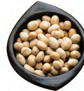
MANÍ CROCANTE TIPO JAPONÉS CON Y SIN AJONJOLÍ