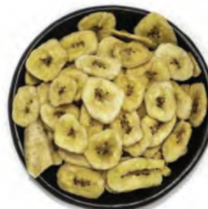
CHIP DULCES DE BANANO