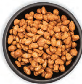
MANÍ CONFITADO CON Y SIN AJONJOLÍ