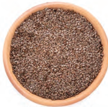
SEMILLA DE LINAZA