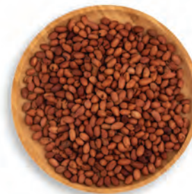
MANÍ CON PIEL BRASILEÑO