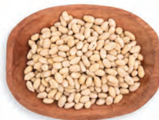
MANÍ BLANCHEADO ARGENTINO/ BRASILEÑO/USA