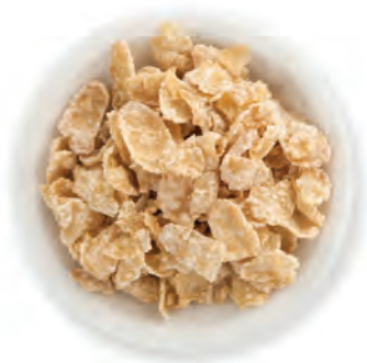
CEREAL HOJUELA AZUCARADA