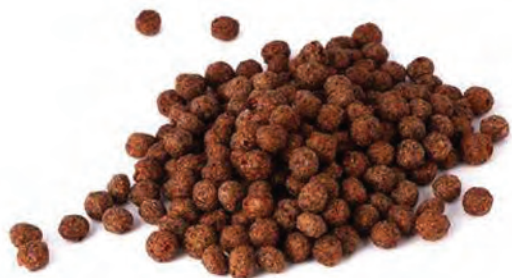
CEREAL EXTRUIDO BOLITAS DE CHOCOLATE