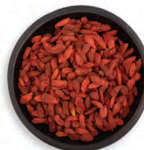
GOJI BERRY BAYA DE GOJI