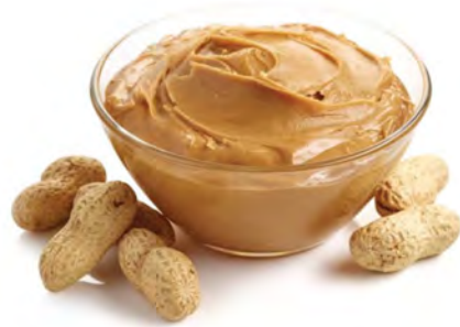
CREMA DE MANÍ