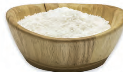
HARINA DE COCO