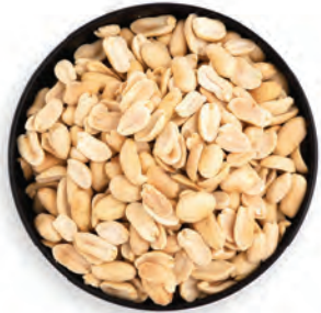
MANÍ TOSTADO CHINO