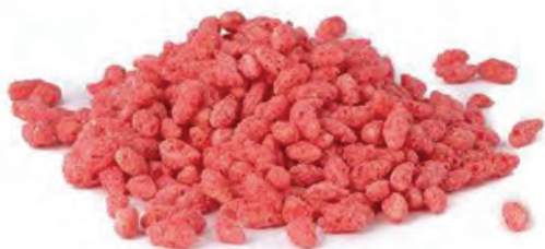
CEREAL EXTRUIDO ARROZ FRESA