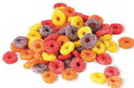
CEREAL EXTRUIDO ARITOS FRUTALES