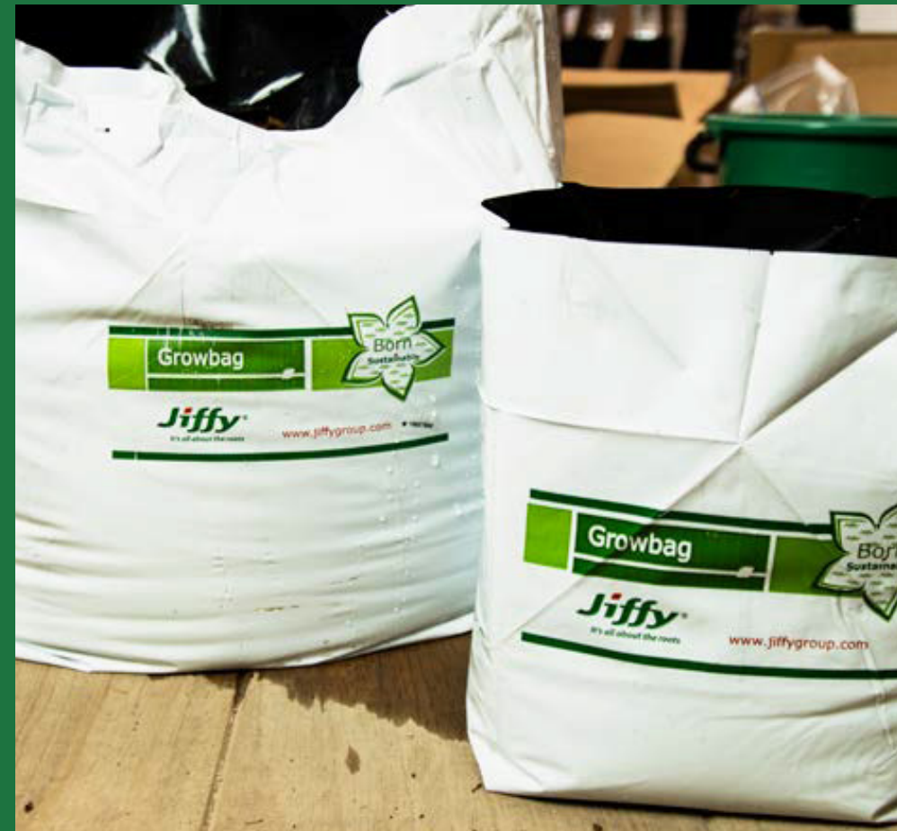
Easy fill bags 8 & 20 L