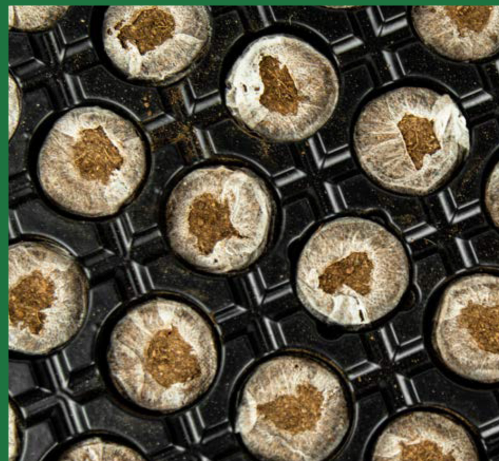
Jiffy 7c 35mm