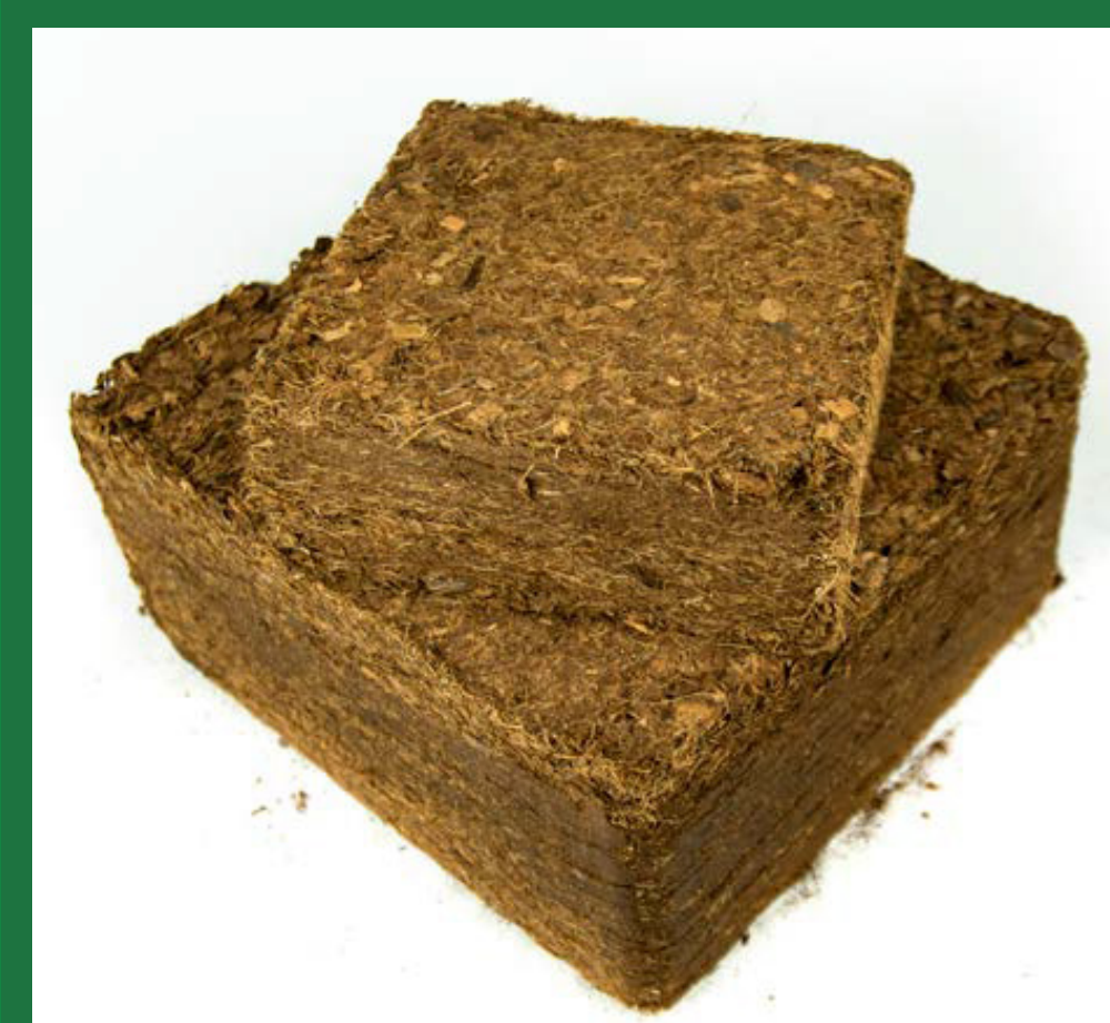
Easy Fill Bag 8L & 20L