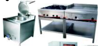
◦ Equipos de Cocina Tradicional