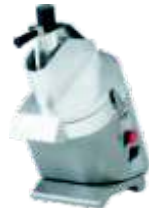
◦ Procesadores de Vegetales