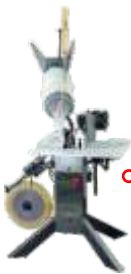
◦ Grapadoras para empaque en malla