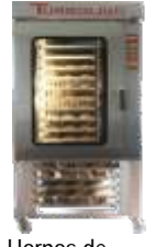
◦ Hornos de Convección