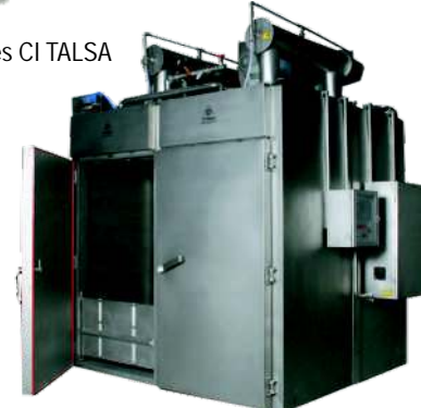
○ Hornos de Cocción CI TALSA