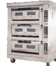
◦ Hornos Gaveteros