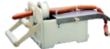
○ Amarradoras Manuales CI TALSA