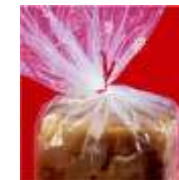
◦ Cintas de Atado

Servicio de mantenimiento preventivo y correctivo, repuestos y asesoría técnica especializada