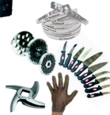
○ Consumibles y Accesorios