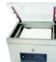
◦ Empacadoras al vacío