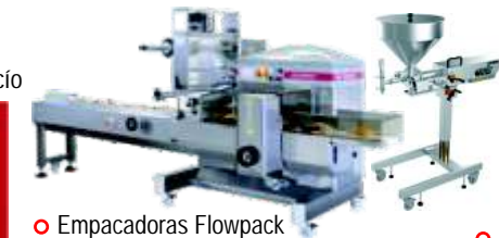
◦ Empacadoras Flowpack