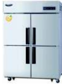
◦ Refrigeración y Congelación