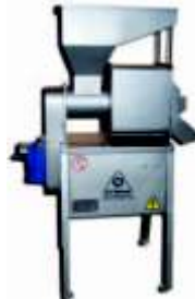
◦ Despulpadoras CI TALSA