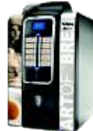
○ Máquinas de Café Semiautomáticas