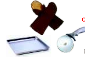
◦ Consumibles y Accesorios