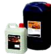
◦ Aceites desmoldantes