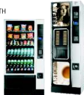
○ Dispensadores vending