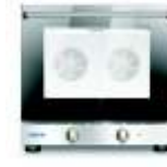
◦ Hornos Punto Caliente