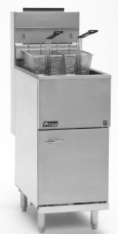
◦ Freidoras PITCO