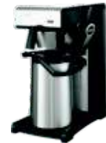
○ Cafeteras de goteo TH