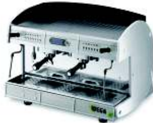
○ Cafeteras Espresso Wega Green Line