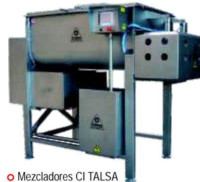
○ Mezcladores CI TALSA