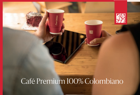
Café Premium 100% Colombiano