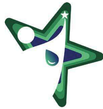
Fundación Salud ESTRELLA DE AGUA