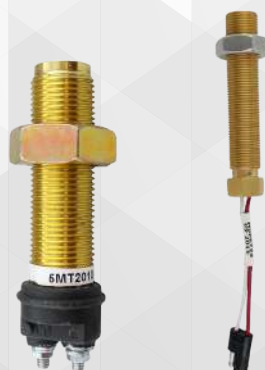
MSP 6744 SP 6715

Una solución robusta y económica para detectar la velocidad del motor.