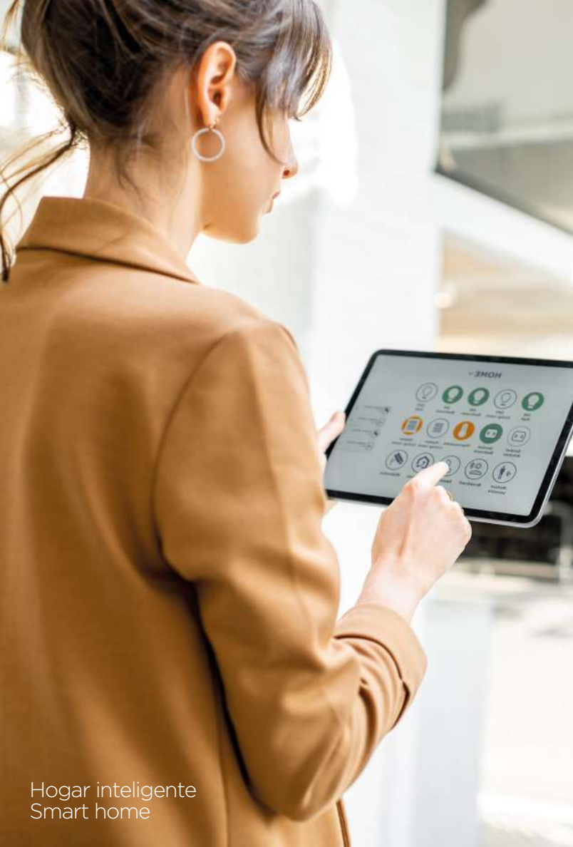
Hogar inteligente Smart home