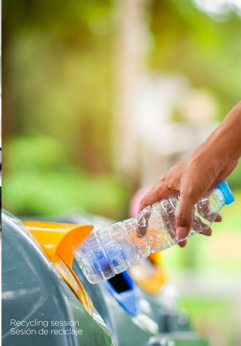
Recycling session Sesión de reciclaje