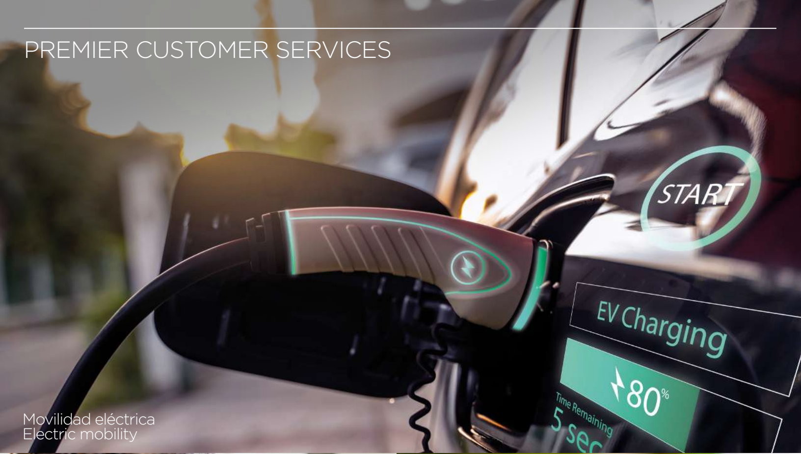
Movilidad eléctrica Electric mobility