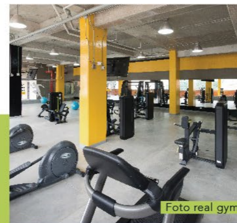
Foto real gym