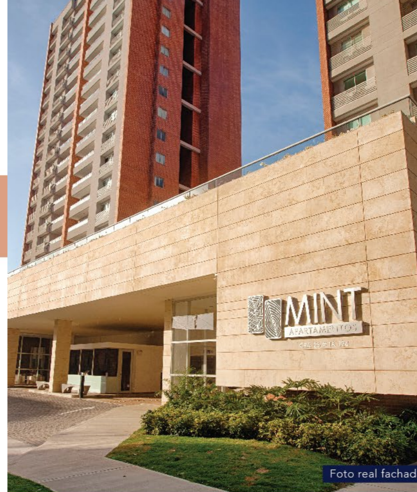
Foto real fachada