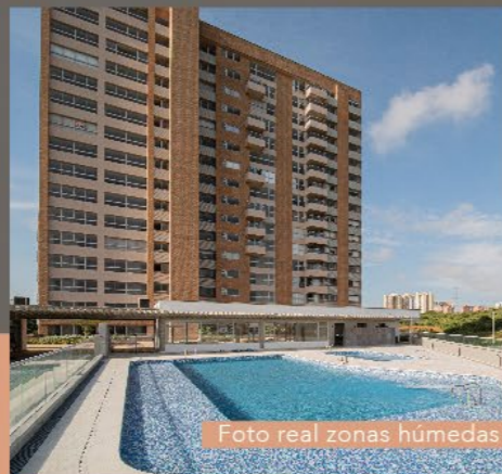
Foto real zonas húmedas