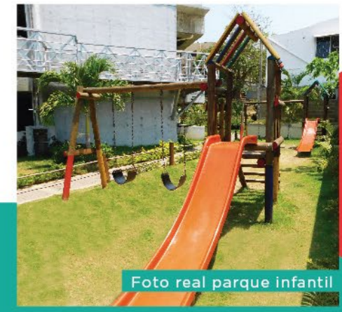
Foto real parque infantil

Apartamentos de 2 y 3 habitaciones Desde 50,16 m 2 hasta 75,35 m 2 áreas construidas