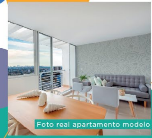
Foto real apartamento modelo