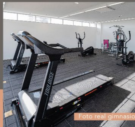
Foto real gimnasio

2 y 3 habitaciones Desde 88 m 2 hasta 159 m 2 áreas construidas BARRANQUILLA, ATLÁNTICO.