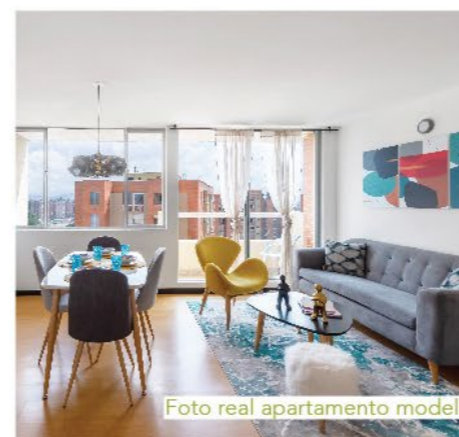
Foto real apartamento modelo