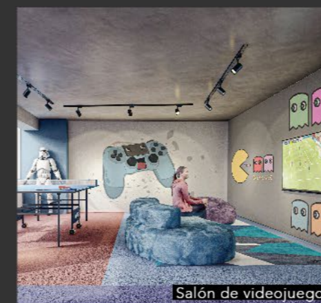
Salón de videojuegos