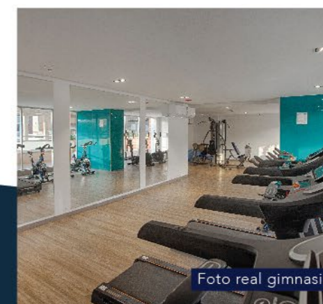
Foto real gimnasio

Apartamentos DESDE 91,97 m 2 HASTA 130,38 m 2 ÁREAS CONSTRUIDAS