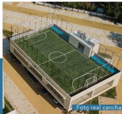
Foto real cancha