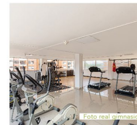
Foto real gimnasio

APARTAMENTOS 70 M 2 Y 84 M 2 ÁREAS CONSTRUIDAS