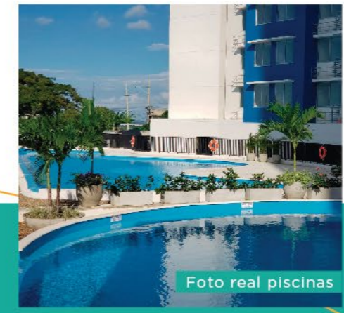
Foto real piscinas