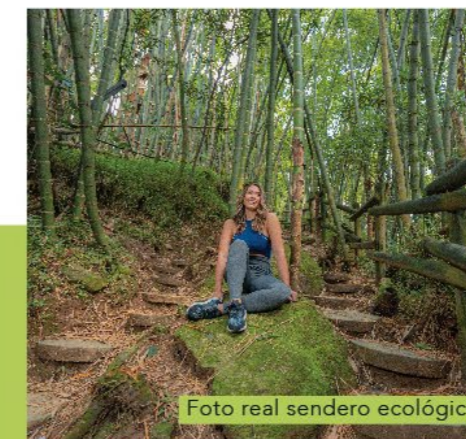
Foto real sendero ecológico