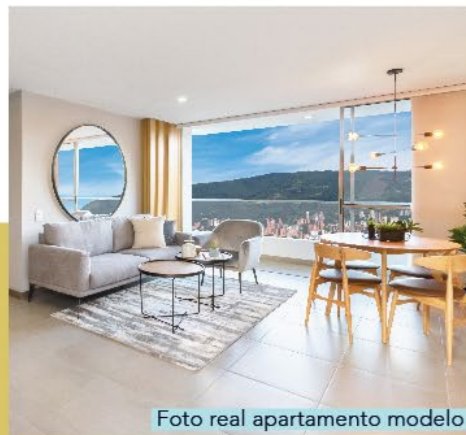
Foto real apartamento modelo