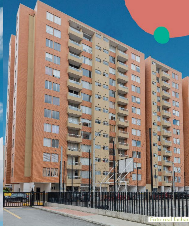
Foto real fachada