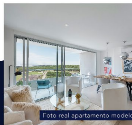
Foto real apartamento modelo