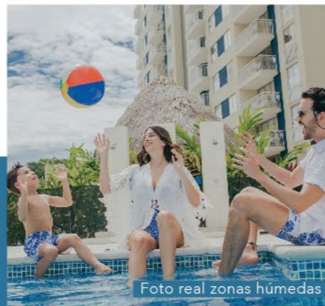
Foto real zonas húmedas