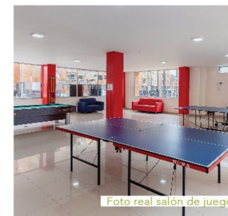
Foto real salón de juegos