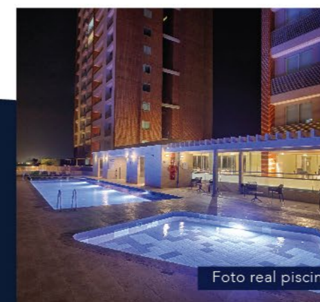
Foto real piscina