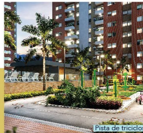
Pista de triciclos

APARTAMENTOS DESDE 64 m 2 HASTA 77 m 2 áreas construidas