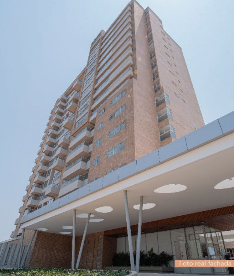
Foto real fachada