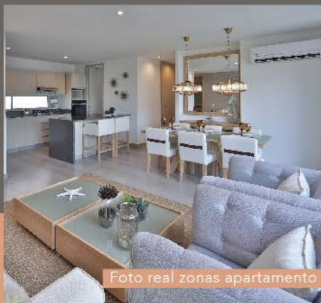
Foto real zonas apartamento