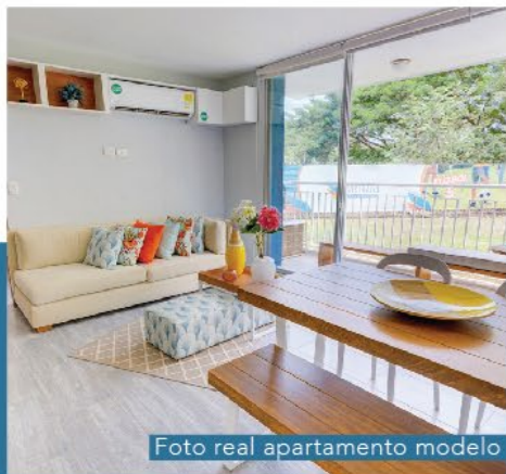
Foto real apartamento modelo