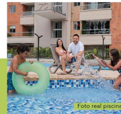
Foto real piscinas