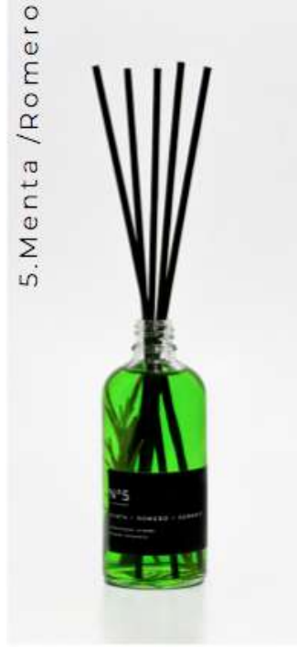
5.Menta /Romero / Geranio