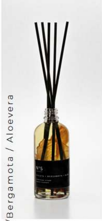
6.Violeta /Bergamota / Aloe vera