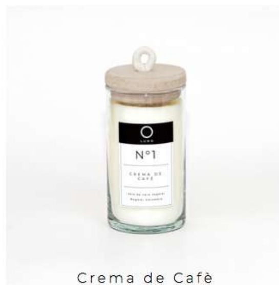
Crema de Café