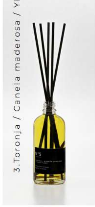
3.Toronja / Canela maderosa / Ylangylang