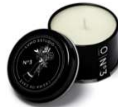
Crema de café