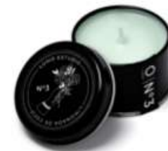
Limonada de coco