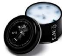
Jasmín y orquídeas