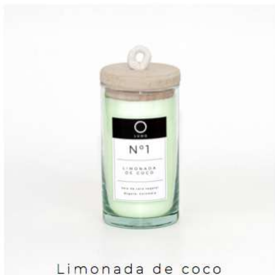
Limonada de coco