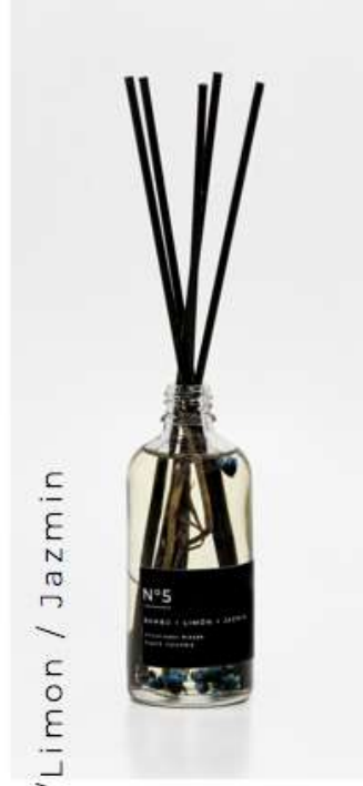
2.Bambu /Limon / Jazmin