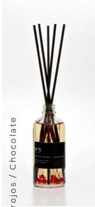
4.Frutos rojos / Chocolate