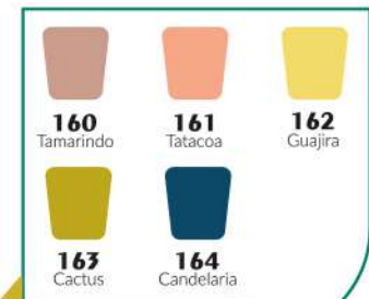
Colección Desiertos de Colombia