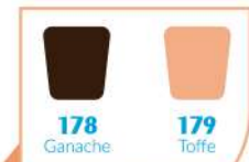
Colección Chocolate Caliente