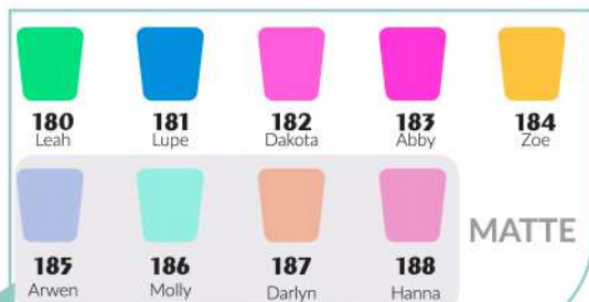
Colección Checo Teens