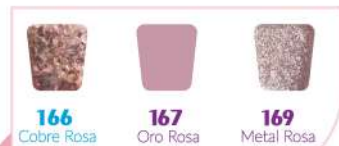
Colección Oro Rosa