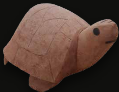
Tortuga Medidas: 20 x 12