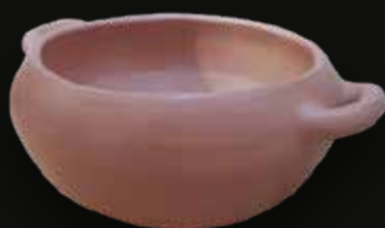
Vasija dos orejas Medidas: 21x21