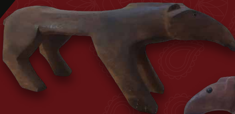
Danta banco Medidas: 120x37x26