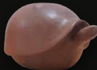
Tortuga Medidas: 17x11