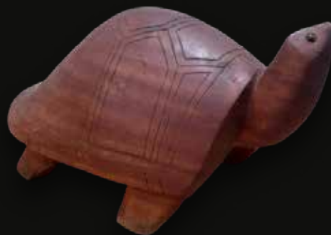
Tortuga Medidas: 51x31x33