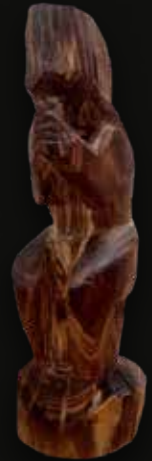
Tótem rectangular Medidas: 33x9