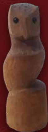
Búho Medidas: 33x11