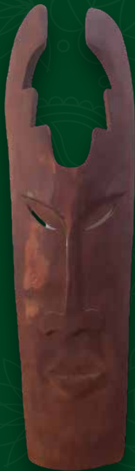
Máscara con mancha Medidas: 123x38