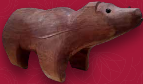
Oso Medidas: 53x23x16