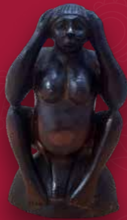
Pensadora Medidas: 18x11