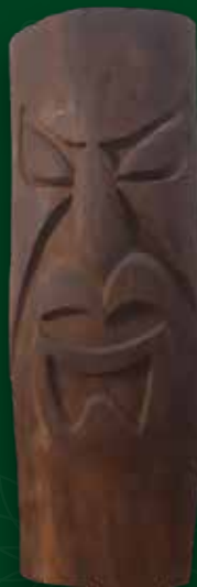
Máscara boca gruesa Medidas: 87x32