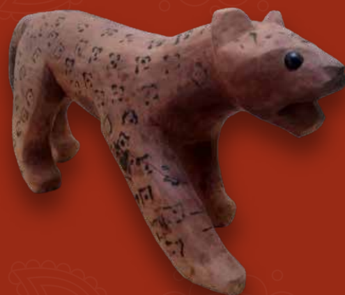
Tigre mariposa Medidas: 5 x 21