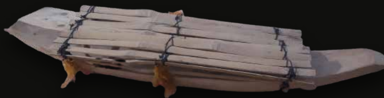
Canoa Medidas: 74x15