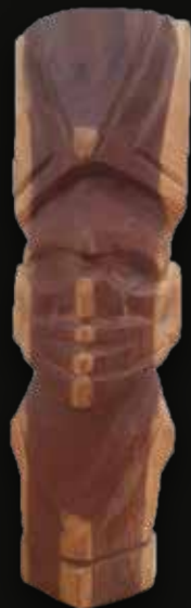
Tótem cara indígena Medidas: 13x31