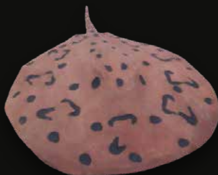
Mantarraya Medidas: 33x20