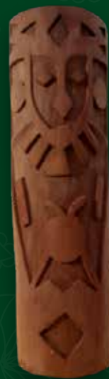
Máscara sol Medidas: 79x24