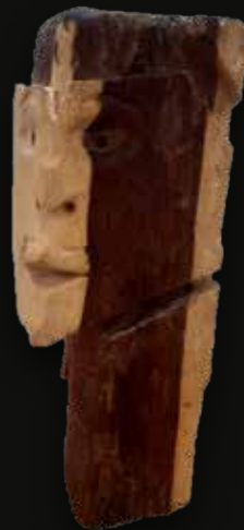
Tótem cara Medidas: 34x13