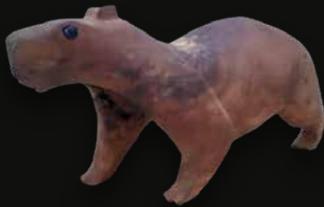
Chigüiro Medidas: 52x16x23