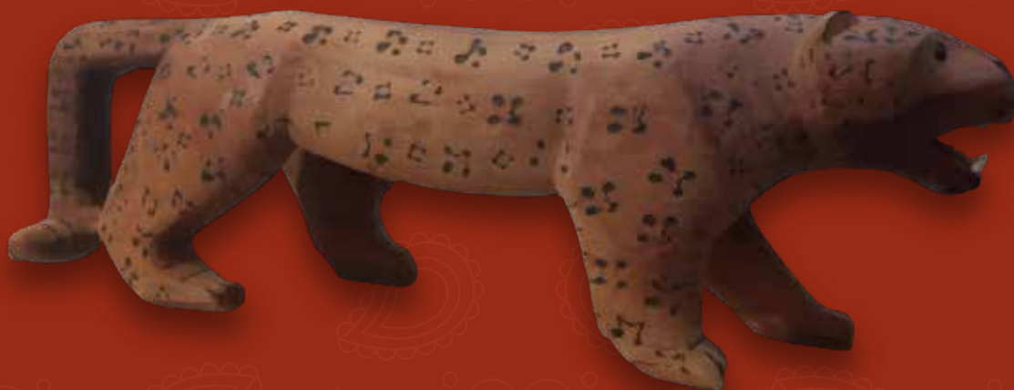
Tigre banco Medidas: 115x37x20