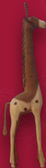
Jirafa Medidas: 48x11