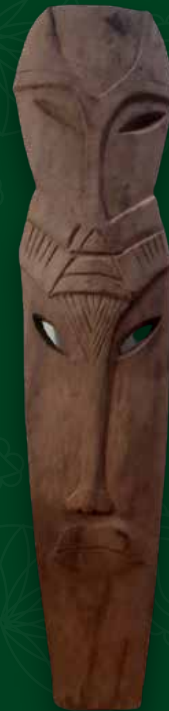
Máscara Medidas: 105x27