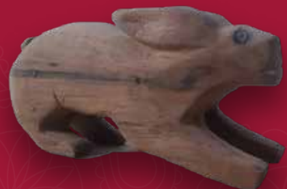
Conejo Medidas: 21x10