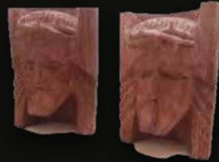
Cristo color claro Medidas: 14x11