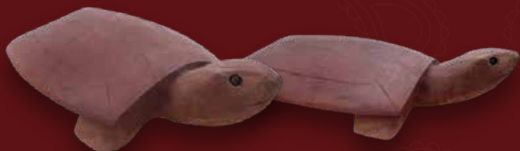
Tortuga Medidas: 52 x 29