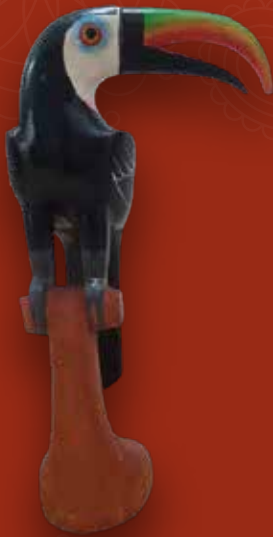
Tucán Medidas: 21x4