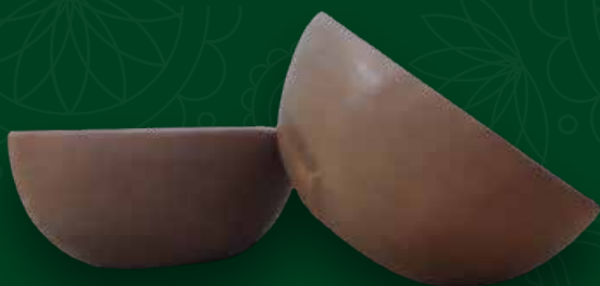
Tacitas Medidas: 10x10