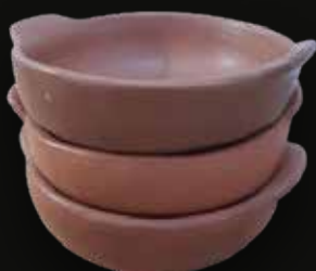
Tazas Medidas: 20x20