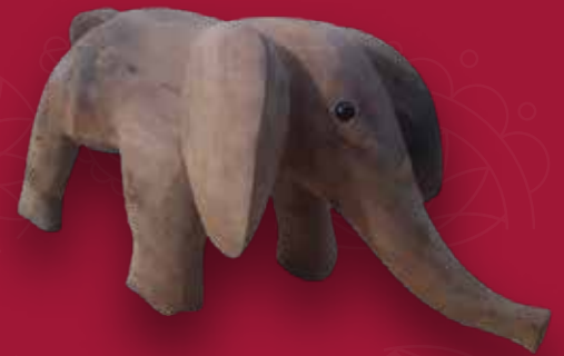
Elefante Medidas: 57x20