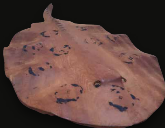
Mantarraya Medidas: 56x27