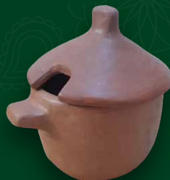
Azucarera Medidas: 12x8