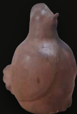
Alcancia gallina Medidas: 15x14