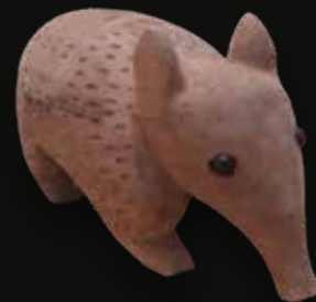
Armadillo Medidas: 56x16