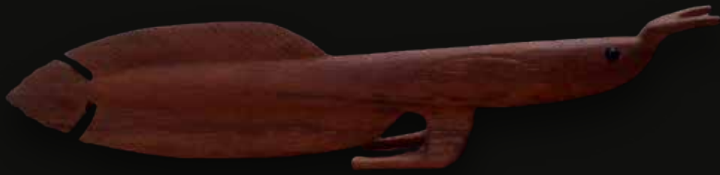
Pez Arawana Medidas: 75x16