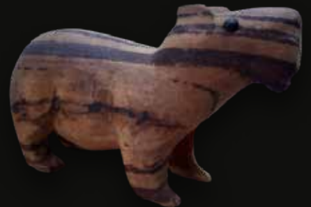
Chigüiro rayado Medidas: 42x8x22