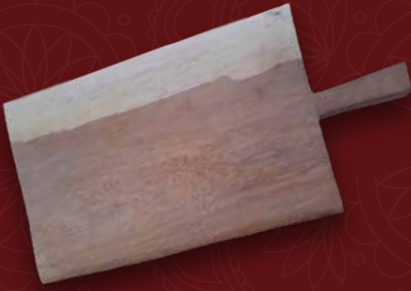
Tabla de picar Medidas: 40x26