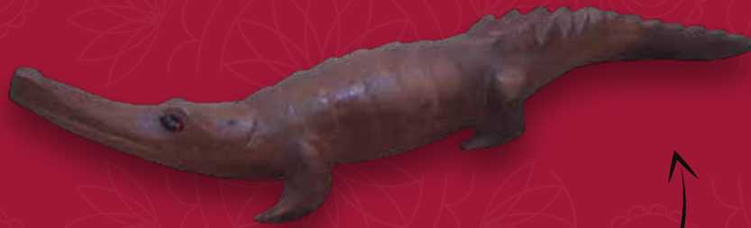
Cocodrilo Medidas: 49x10