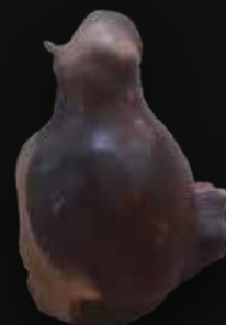
Gallina Medidas: 17x10