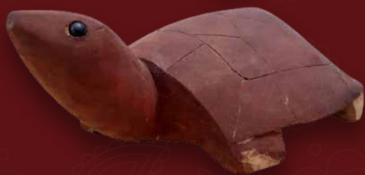
Tortuga Medidas: 52 x 28