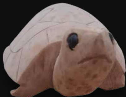
Tortuga Medidas: 32 x 20