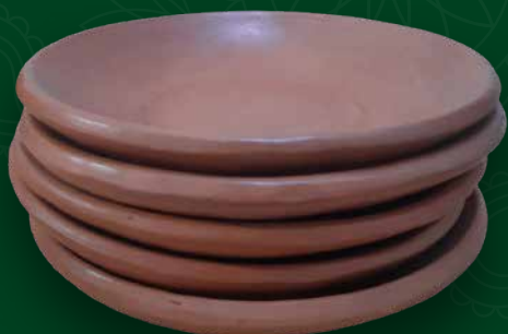
Platos Medidas: 20x20