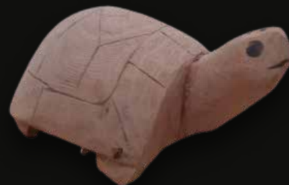
Tortuga Medidas: 20 x 10