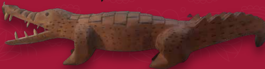
Cocodrilo Medidas: 160x25x35