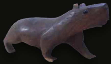
Chigüiro Medidas: 53x15x20