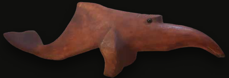
Delfín Medidas: 75x24