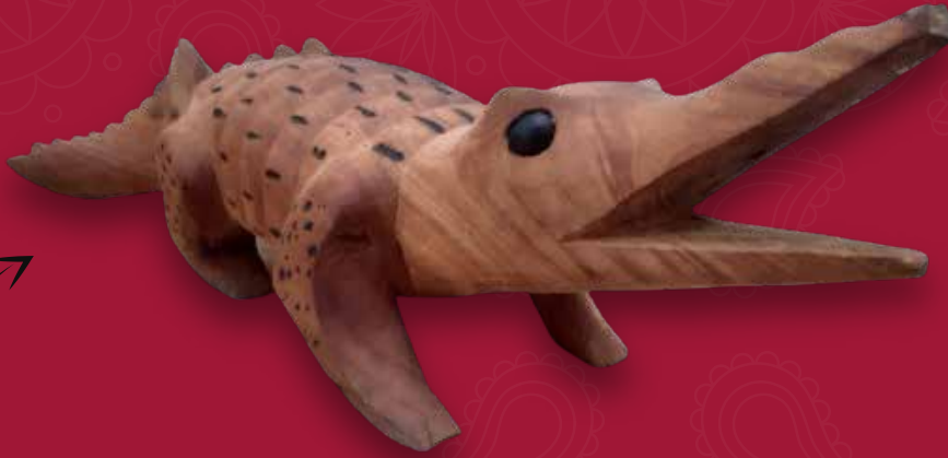
Cocodrilo Medidas: 68x18x11