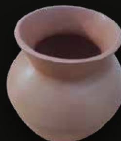
Cántaro Medidas: 26x17