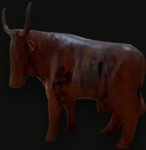
Toro Material: Madera Vera Medidas: 30x20