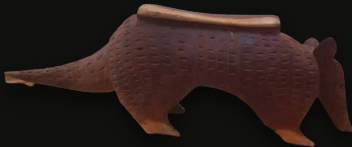
Armadillo banco Medidas: 110x35x26