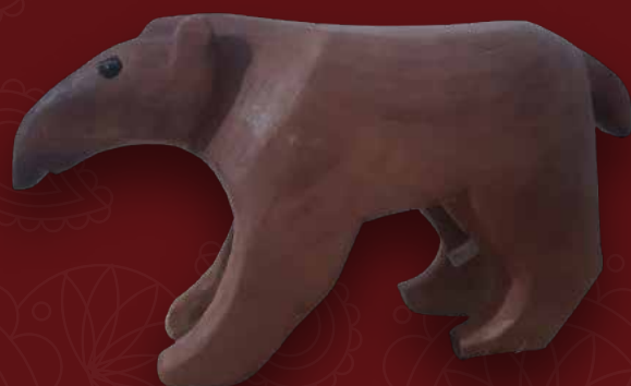
Danta banquito Medidas: 38x19x10