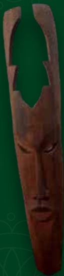
Máscara venado Medidas: 87x18