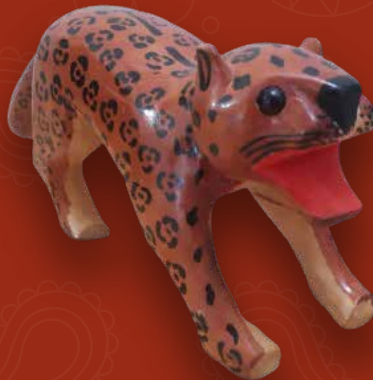
Tigre mariposa Medidas: 10x52