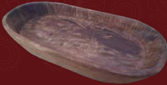
Bandeja Medidas: 55x26