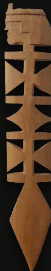
Flecha en madera Medidas: 47x9