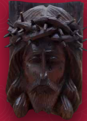
Cristo porta lápices Medidas: 15x10