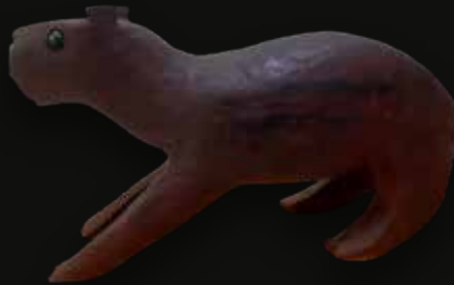
Chigüiro Medidas: 57x25x23