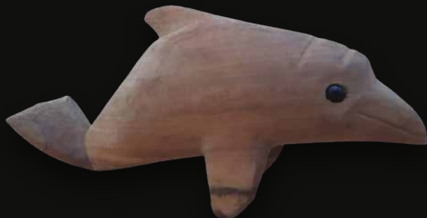
Delfín Medidas: 35x17