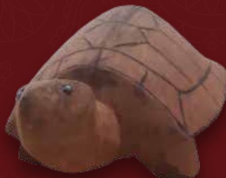
Tortuga Medidas: 28 x 16