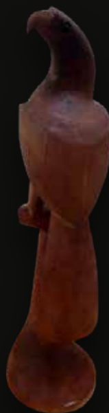
Águila Medidas: 60x16