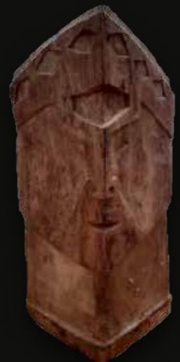
Tótem cara grande triangular Medidas: 20x30