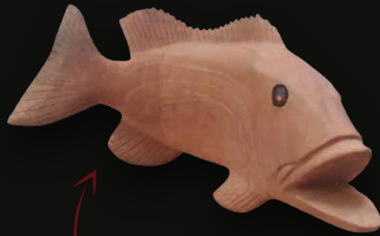
Pez pavón curvo Medidas: 52x21