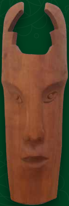
Máscara Medidas: 18x53