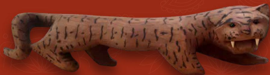
Tigre banco Medidas: 88x18x20