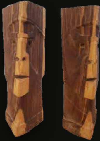
Tótem triangular Medidas: 31x9