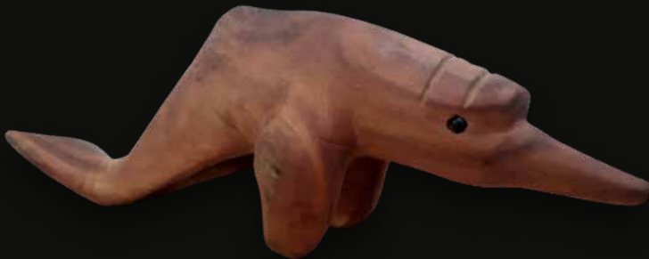
Delfín Medidas: 58x20