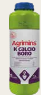
Agrimins® K Calcio Boro