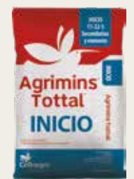
Agrimins® Tottal Inicio 50 g / árbol