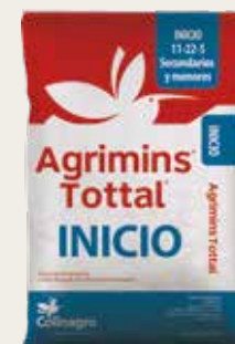
Agrimins ® Tottal ® Inicio