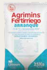
Agrimins ® Fertirriego Arranque