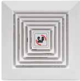
CENTRÍFUGO DE FALSO PLAFÓN CFP