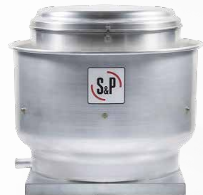
EXTRACTOR TIPO HONGO CRV