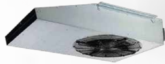
JET FAN DE IMPULSO IFHT