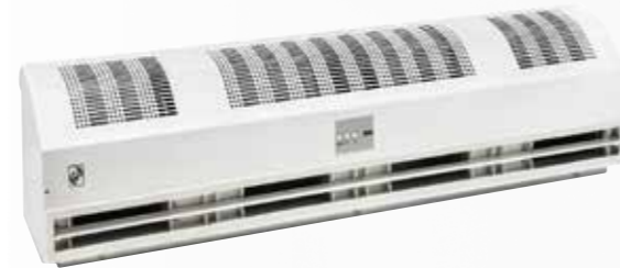
CORTINA DE AIRE CAF