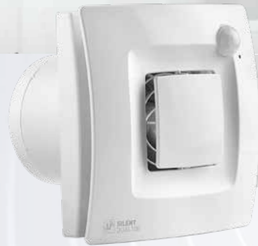
EXTRACTOR DE BAÑO SILENT DUAL