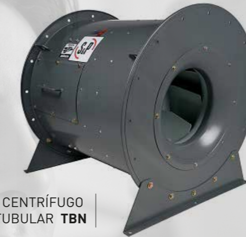
CENTRÍFUGO TUBULAR TBN