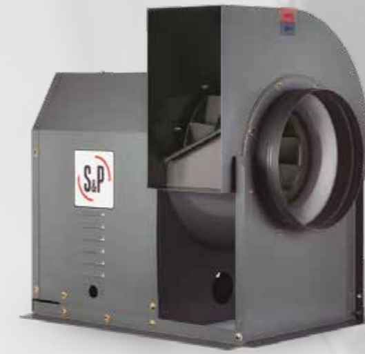
CENTRÍFUGO TIPO VENT-SET CM

NUESTRO MEDIO ES EL AIRE. POR ESO NOS ENCONTRARÁ EN TODOS LOS SEGMENTOS DEL SECTOR DE LA VENTILACIÓN.