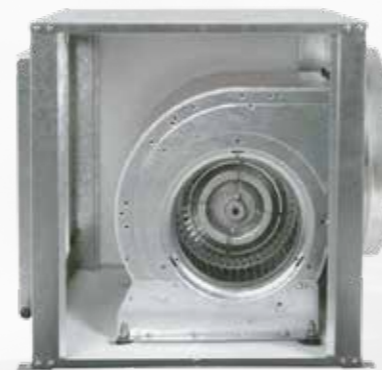
CAJA DE VENTILACIÓN CRV