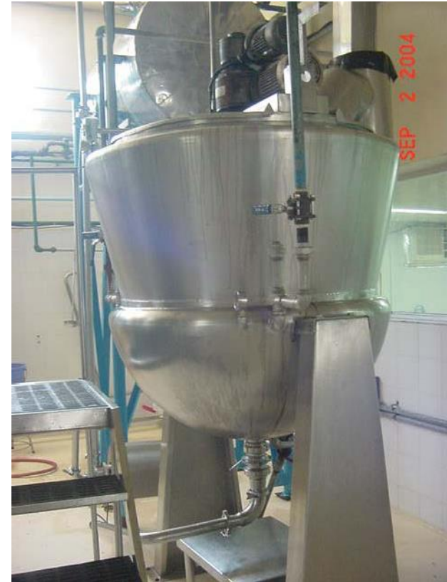
MARMITA PARA PREPARACION DE AREQUIPE VOLUMEN DE LECHE LIQUIDA 600 LITROS MATERIAL: ACERO INOXIDABLE TIPO AISI 304