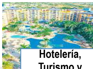
Hotelería, Turismo y Entretenimiento