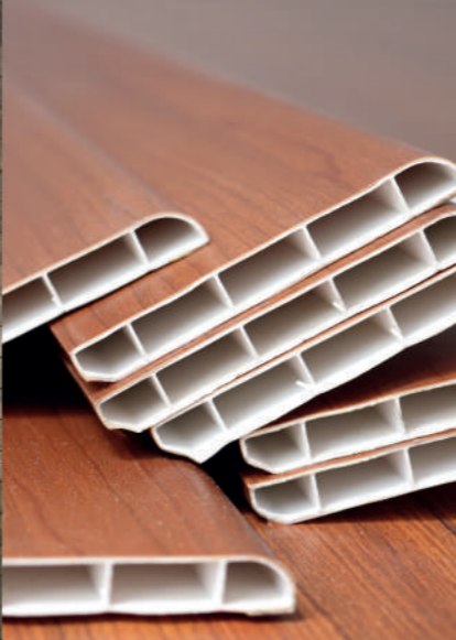
ZÓCALO EN PVC