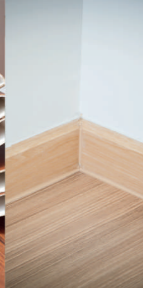
ZÓCALO EN MDF