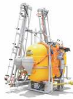
FUMIGACIÓN DE CULTIVOS