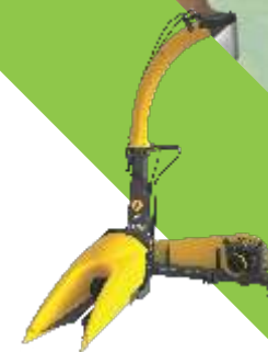
ESPECIALIZADOS PARA SILO / HENOLAJE