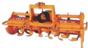
PREPARACIÓN DE TIERRA

●●● IMPLEMENTOS AGRÍCOLAS PARA TODO TIPO DE OPERACIÓN AGRÍCOLA