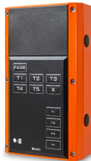
Versión sin altavoz