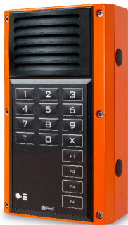
Versión con altoparlante

La línea "EX" de la Serie 7000 ha sido desarrollada con una atención minuciosa a los exigentes requisitos para entornos peligrosos y explosivos. Por supuesto, los dispositivos están certificados internacionalmente.