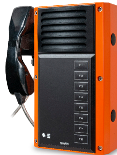
Versión con auricular