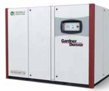
EnviroAire TVS 110 - 315 kW 115 - 145 PSIG 316 - 825 CFM