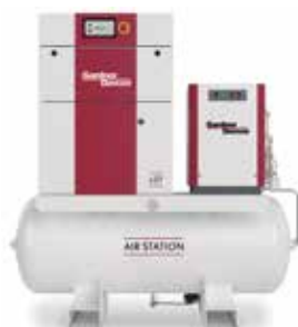
Serie L 15 - 30 HP 100 - 190 PSIG 20 - 147 CFM