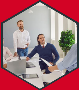
ADMINISTRACIÓN DE INMUEBLES