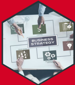
ASESORÍA EN PLANEACIÓN DE NEGOCIOS