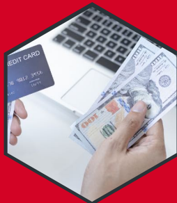
CREACIÓN CRÉDITO CORPORATIVO