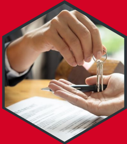
SERVICIO DE REALTOR