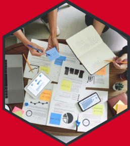
APERTURA DE EMPRESAS