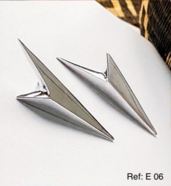
Ref: E 06