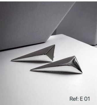
Ref: E 01