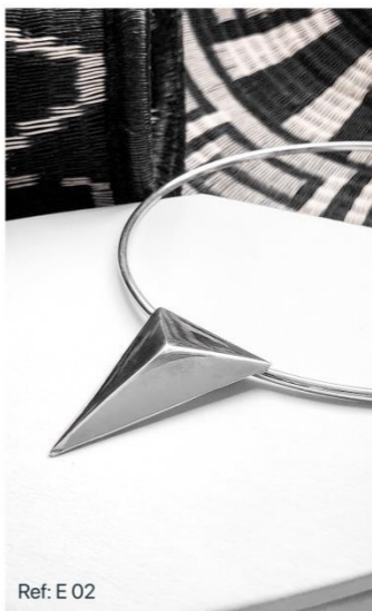
Ref: E 02