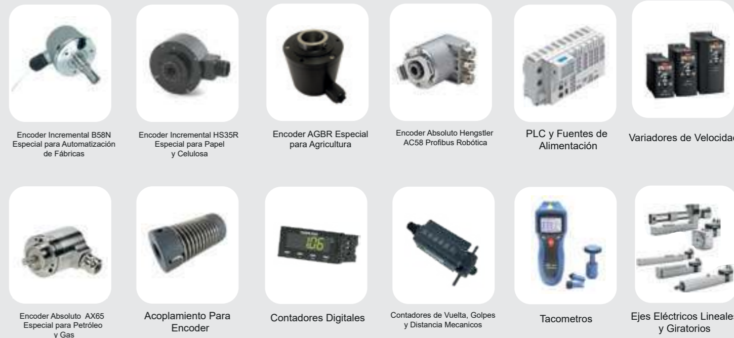
Encoder Incremental B58N Especial para Automatización de Fábricas Encoder Incremental HS35R Especial para Papel y Celulosa Encoder AGBR Especial para Agricultura Encoder Absoluto Hengstler AC58 Profibus Robótica PLC y Fuentes de Alimentación Variadores de Velocidad Encoder Absoluto AX65 Especial para Petróleo y Gas Acoplamiento Para Encoder Contadores Digitales Contadores de Vuelta, Golpes y Distancia Mecánicos Tacómetros Ejes Eléctricos Lineales y Giratorios