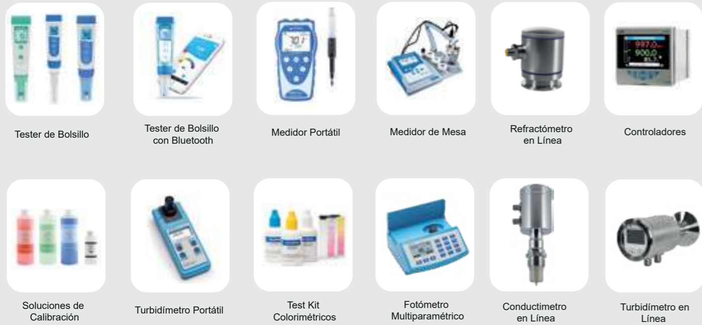
Tester de Bolsillo Tester de Bolsillo con Bluetooth Medidor Portátil Medidor de Mesa Refractómetro en Línea Controladores Soluciones de Calibración Turbidímetro Portátil Test Kit Colorimétricos Fotómetro Multiparamétrico Conductímetro en Línea Turbidímetro en Línea