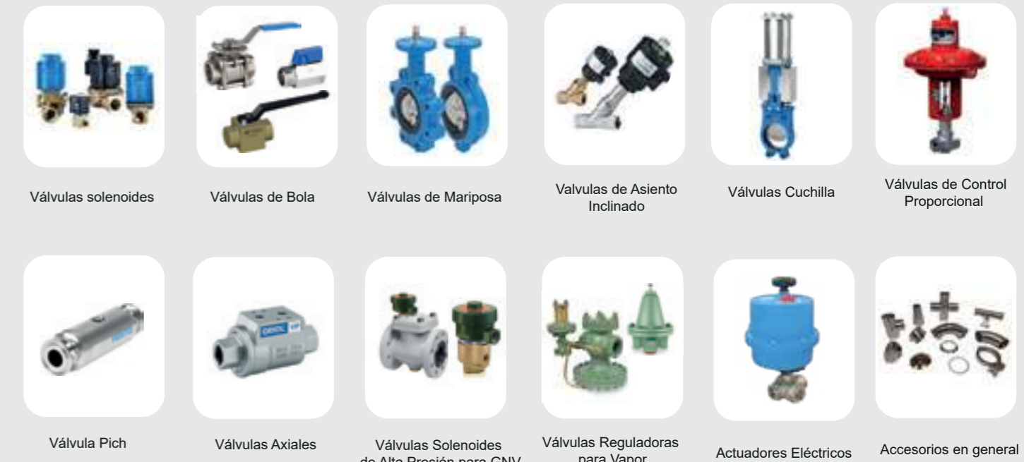
Válvulas solenoides Válvulas de Bola Válvulas de Mariposa Válvulas de Asiento Inclinado Válvulas Cuchilla Válvulas de Control Proporcional Válvula Pich Válvulas Axiales Válvulas Solenoides de Alta Presión para GNV Válvulas Reguladoras para Vapor Actuadores Eléctricos Accesorios en general