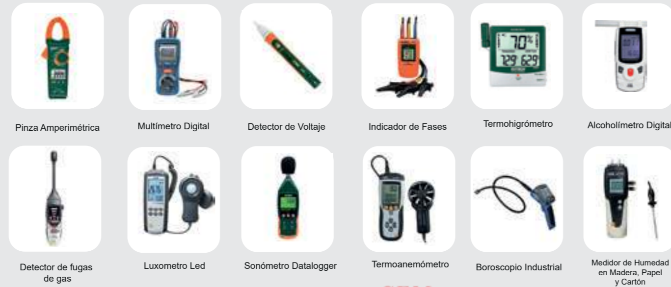
Pinza Amperimétrica Multímetro Digital Detector de Voltaje Indicador de Fases Termohigrómetro Alcoholímetro Digital Detector de fugas de gas Luxómetro Led Sonómetro Datalogger Termoanemómetro Boroscopio Industrial Medidor de Humedad en Madera, Papel y Cartón