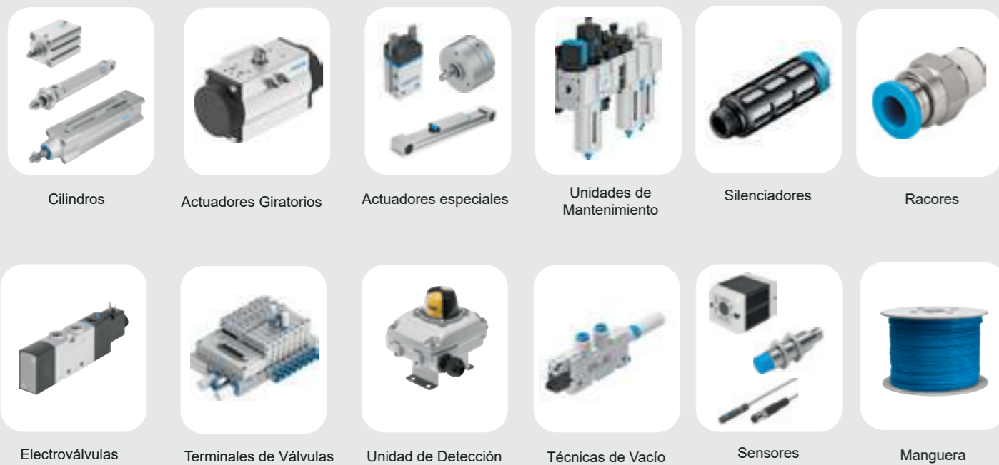
Cilindros Actuadores Giratorios Actuadores especiales Unidades de Mantenimiento Silenciadores Racores Electroválvulas Terminales de Válvulas Unidad de Detección Técnicas de Vacío Sensores Manguera