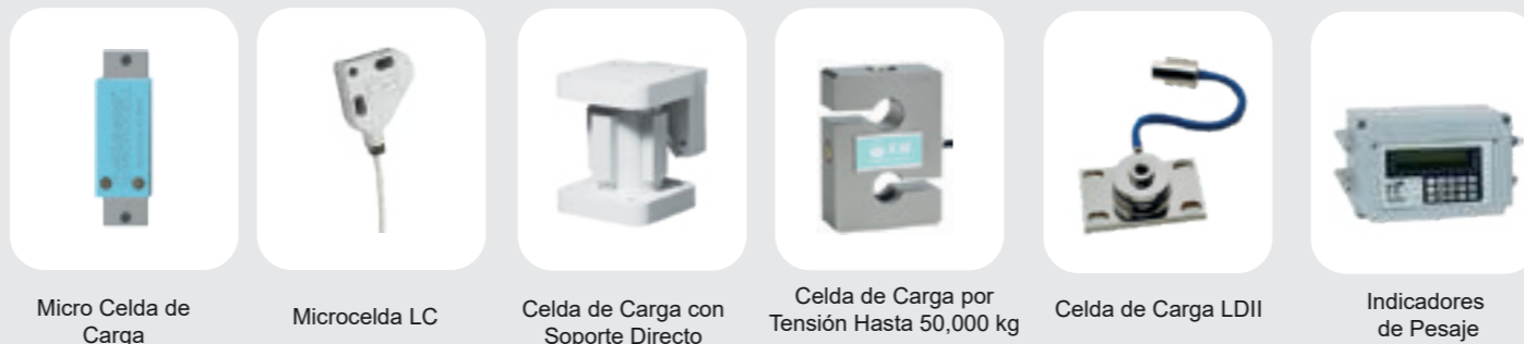
Micro Celda de Carga Microcelda LC Celda de Carga con Soporte Directo Celda de Carga por Tensión Hasta 50,000 kg Celda de Carga LDII Indicadores de Pesaje