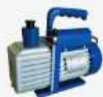
Bomba de vacío