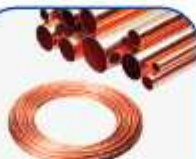
Tubería de cobre