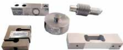
Celdas de Carga