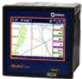
CMC 99 / CMC 141