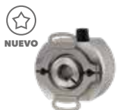
MODEL 260 Eje Hueco