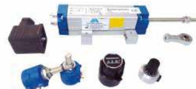
PL LINEAR Sensores de Posición Lineal Potenciómetros e Indicadores