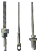
Termocuplas Bayoneta Arandela Nozzle