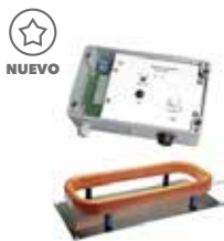
MDS 3065/95 + MU 3300/MDV 3172 Detector de Metales