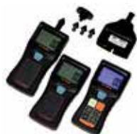
TM-7010 Tacómetro Portátil