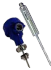
Conexiones Sanitarias RTD PT100 PT1000 TC. J,K,R,S