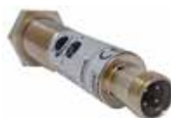
FT 18SM Sensor reflex