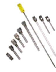
Termopozos Acero Inoxidable, Perforados, Soldados