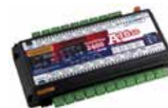
2400 - A16