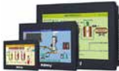
HMI TÁCTIL+PLC Flexipanel

PLC con Módulos de Expansión Entradas y Salidas Análogas / Digital Ethernet Alta Velocidad - Expandible