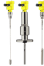
SERIE 80 Vegaflex