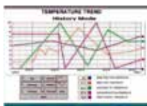
Software Scada Astra