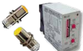
CRTP Interruptores de Velocidad