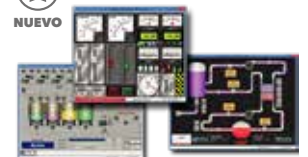
Software Winlog Aplicaciones HMI/SCADA