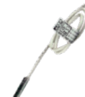
Modelo SHP Para cilindros