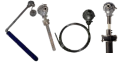
PT100 / TERMOPAR Aplicaciones Especiales Fundiciones Productos Abrasivos Altas temperaturas Ácidos