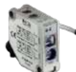
Modelo FTQ Autoreflex