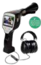
Detector de Fugas LD 500