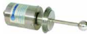
VA 100B ESPHERE 10 - 25.000 mPa-s X gr/cm 3