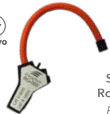
Sensor Rogowski RG 500.