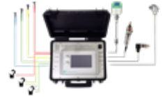
D500 PM Mobile Medición de la eficiencia de compresores

Módulos Externos Análogo / Digital Entradas y Salidas Modbus - RTU Ethernet