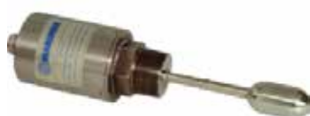
VA 100C CYLINDER 0,1 - 2.500 mPa-s X gr/cm 3