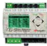
NG - 9 - PLUS