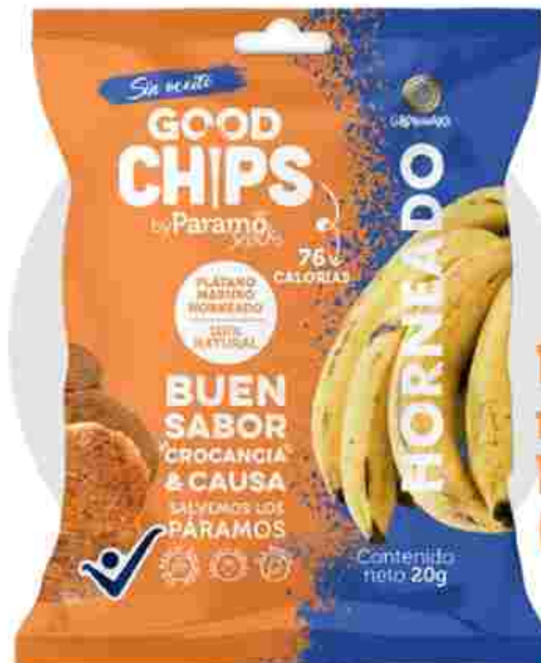
Plátano maduro horneado (20g)