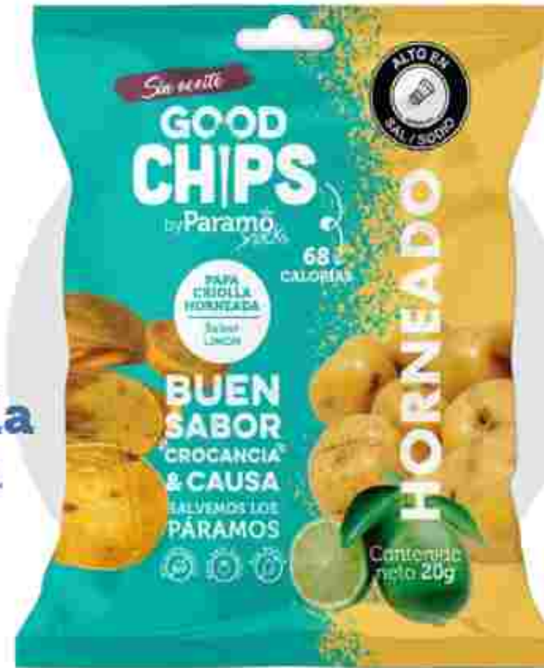
Papa criolla Limón horneada (20g)