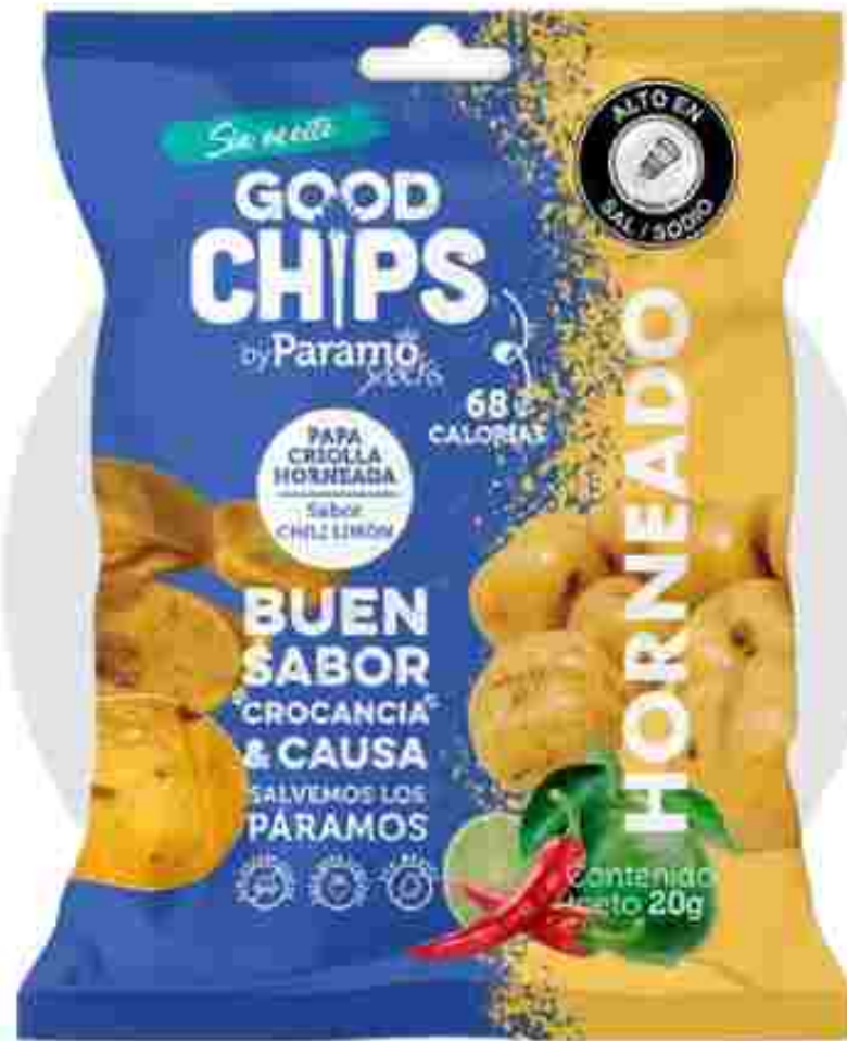
Papa criolla Chili-limón horneada (20g)