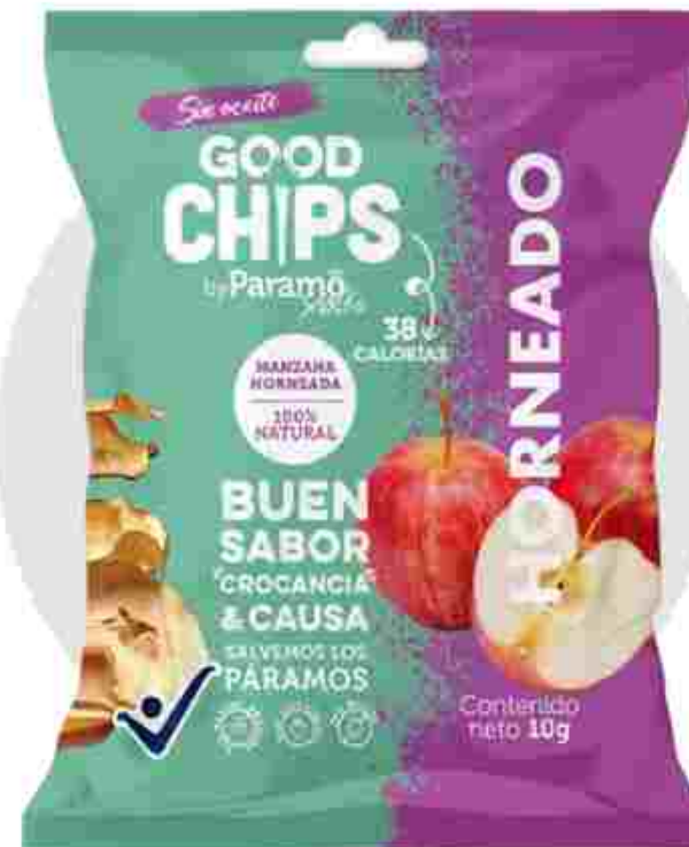
Manzana horneada (10g)