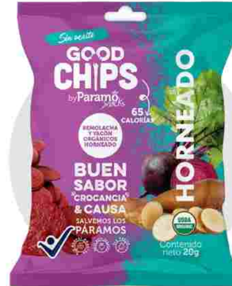
Remolacha orgánica y Yacón orgánico horneados (20g)