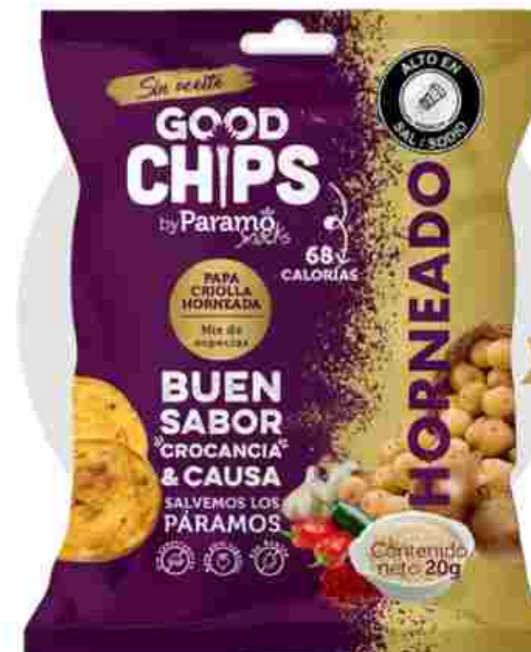
Papa criolla Mix de especias horneada (20g)