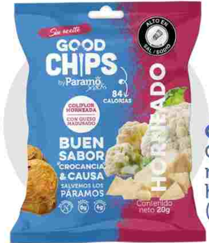
Coliflor Queso maduro horneada (20g)