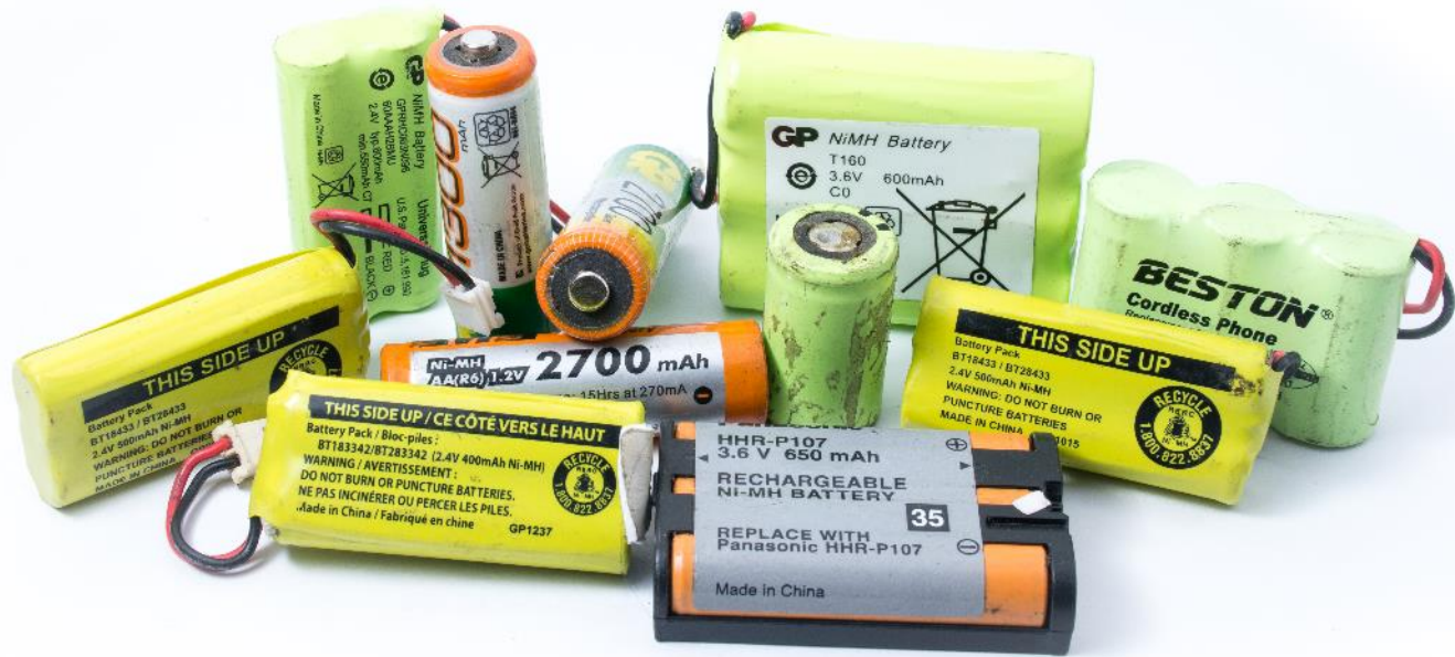
Transfórmalos Residuos de baterías Níquel metal hidruro Ni-MH provenientes de herramientas y juguetes electrónicos