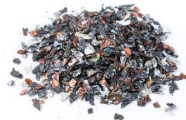
Metales y polímeros