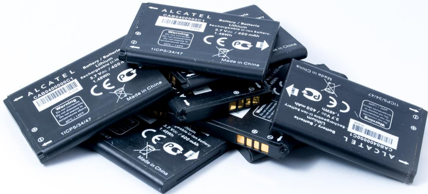
Transformamos Residuos de baterías Li-ion prismáticas provenientes de celulares