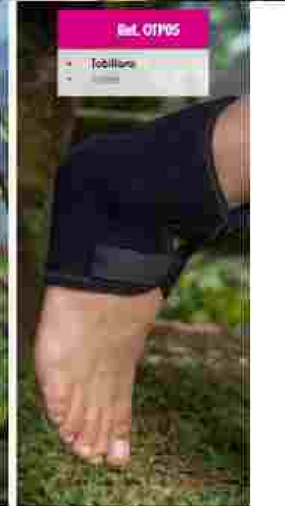
Ref. OTF05 • Tobillera • Soporte