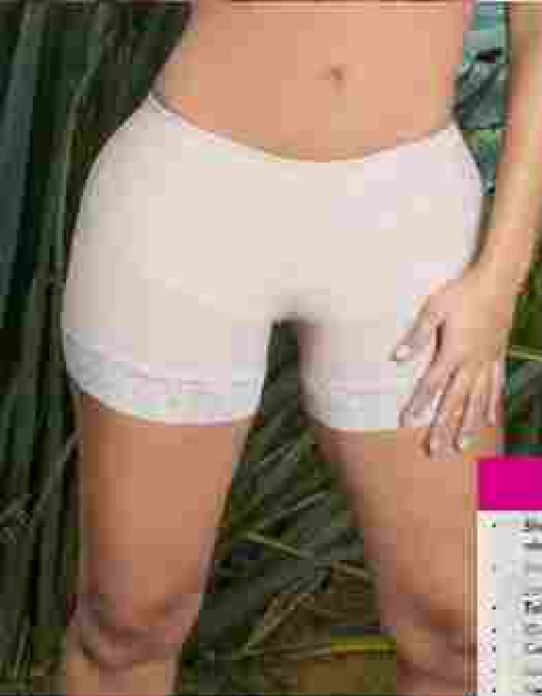
No. 5CA02 • Short Lavanda control abdomen • Short Lavanda Glúteo • Talla/size: 36-38 / 34-36 / 32-34 • Colores/color: Lavanda • Medidas: 100-110cm