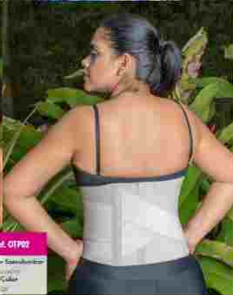
Ref. OTF02 • Corrector de postura • Espalda • Columna C6-C8 • Soporte lumbar