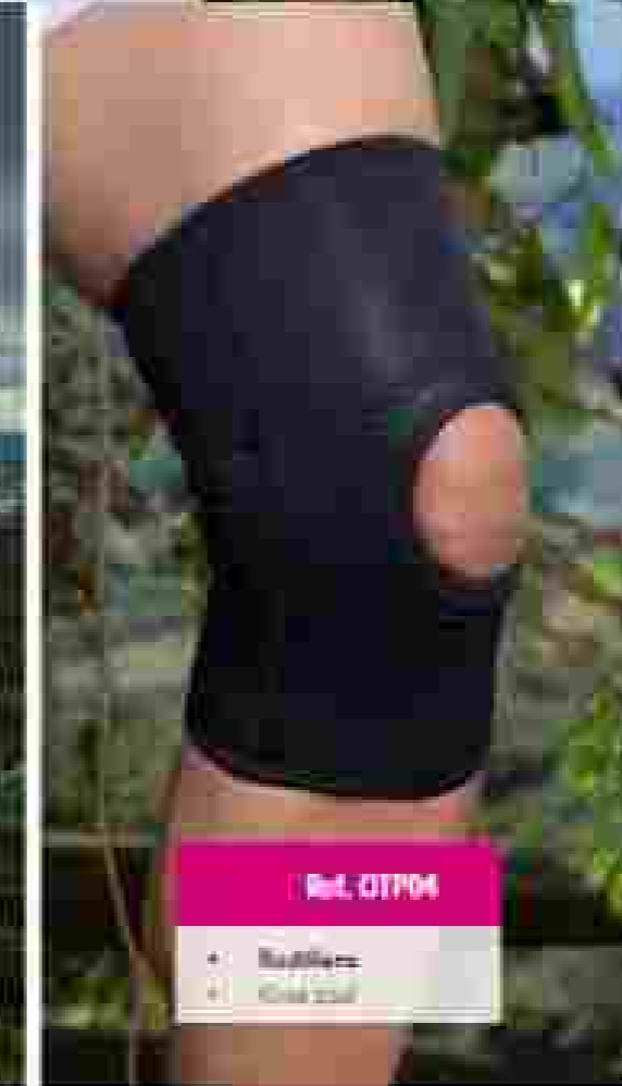
Ref. OTF04 • Rodillera • Soporte