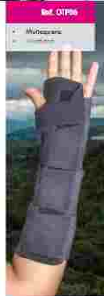
Ref. OTF06 • Muñequera • Soporte