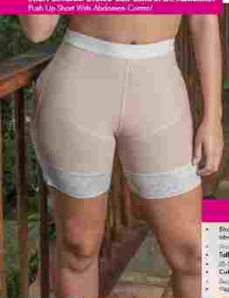
No. 5CA01 • Short alta control de abdomen • Short Lavanda Glúteo • Talla/size: 36-38 / 34-36 / 32-34 • Colores/color: Lavanda • Medidas: 100-110cm