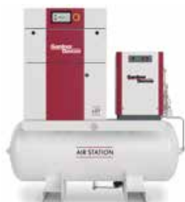
Serie L 15 - 30 HP 100 - 190 PSIG 20 - 147 CFM