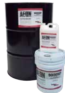
Aceites sintéticos y semi-sintéticos