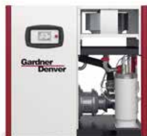
Serie L-RS 7- 290 kW 75 - 190 PSIG 29 - 1620 CFM

“Nuestra alta gama de equipos nos permite brindarles soluciones desde equipos de 2HP hasta 500HP, logrando atender todo tipo de mercado”