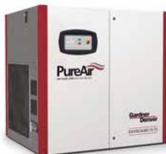
EnviroAire VS 15 – 110 kW 75 – 145 PSIG 65 – 655 CFM

PureAir ISO CLASS: ZERO PLUS SILICONE FREE