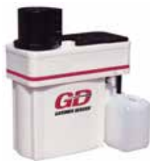
Separadores de agua y aceite