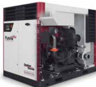
Quantima 150 – 300 kW 73 – 116 PSIG 750 – 1860 CFM