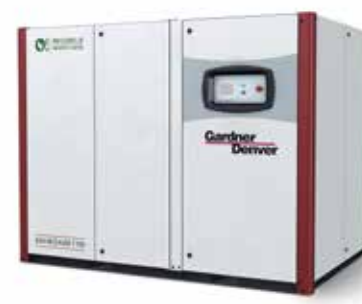
EnviroAire TVS 110 – 315 kW 115 – 145 PSIG 316 – 825 CFM