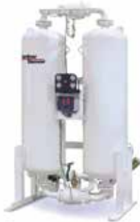
Secadores refrigerados cíclicos y no cíclicos

En Maq&Tec le ofrecemos soluciones acordes a sus necesidades.