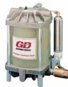
Trampas de drenaje