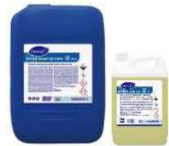
Limpiadores desengrasantes desinfectantes Clorados