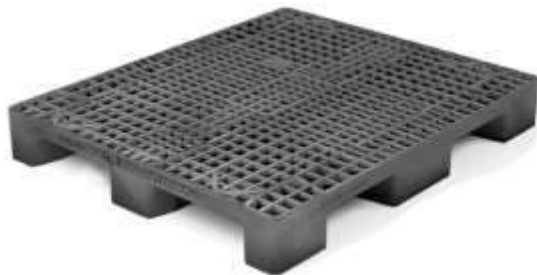
Estiba piso 100cmx120cmx15cm ER-100S-4E-V1 cuatro entradas ventilado maximo