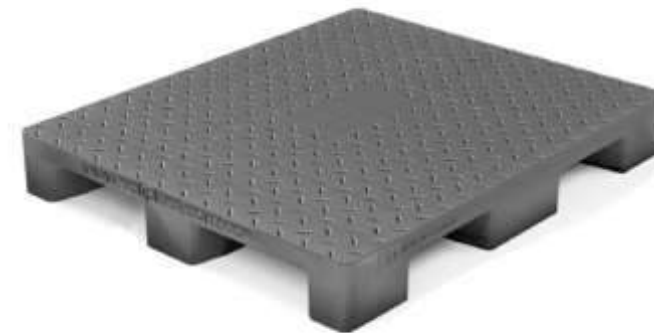
Estiba piso 120cm x120cm x15cm ER-120 dos entradas lisas