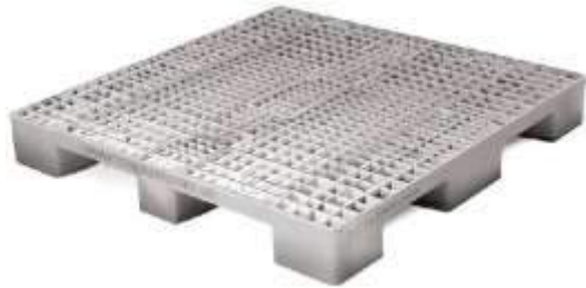
Estiba estanteria 100cmx120cmx15cm ER-100-V1 dosentradas ventilado maximo