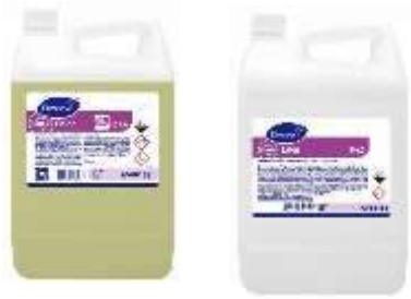
Desinfección de alimentos