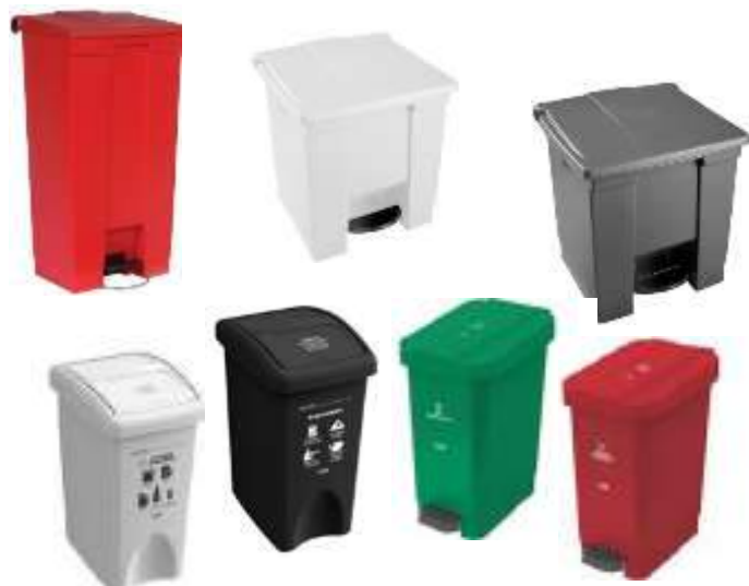
Papeleras de pedal