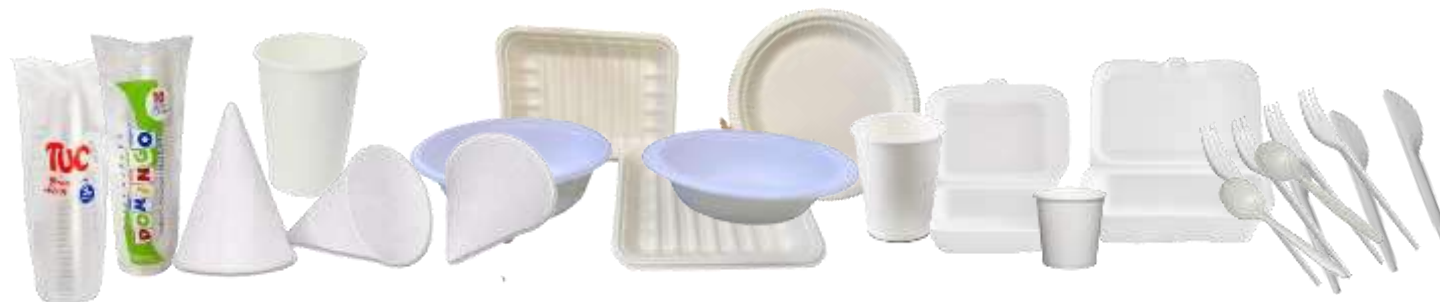
Línea biodegradable y no Biodegradable