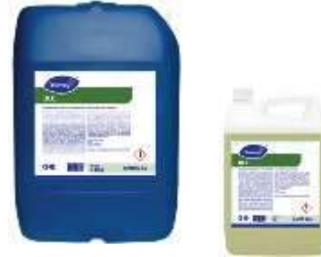
Detergente de uso general