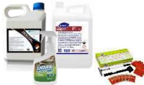
Limpieza de parrillas