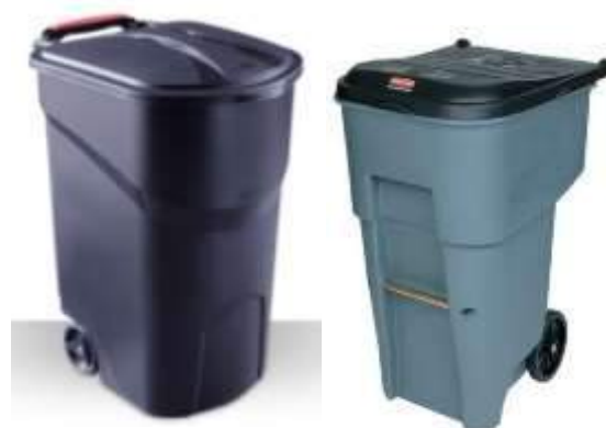
Contenedores con ruedas