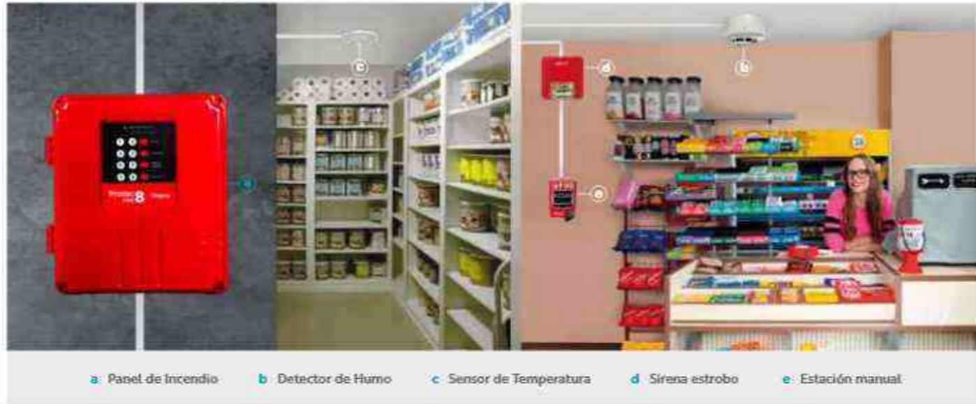
a: Panel de Incendio b: Detector de Humo c: Sensor de Temperatura d: Sirena estrobo e: Estación manual.

Es un panel centralizado diseñado para alertar eventos de fuego en etapa temprana. Ideal para pequeños negocios como barberías, farmacias, cabinas de internet, licorerías, bodegas, librerías, etc.