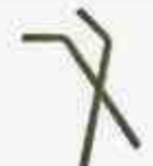
POSTE TEMPLADOR Y INTERMEDIO DE 4 HILOS

Poste de alta resistencia y con pintura electroestática.