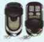
CONTROL REMOTO DE 4 BOTONES

Enciende y apaga energizadores a 500m. de distancia en campo abierto.