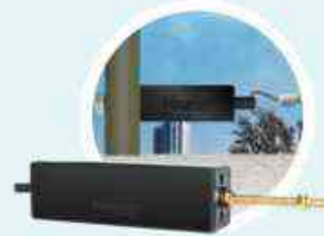
SENSOR DE FLEXIÓN by Hagroy®

Hecho con materiales resistentes a los rayos UV y siguiendo las normas IEC.