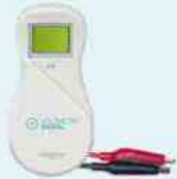
VOLTIMETRO DIGITAL by Hagroy®

Mide el voltaje del cerco eléctrico con una pantalla digital mostrando el voltaje en KV.