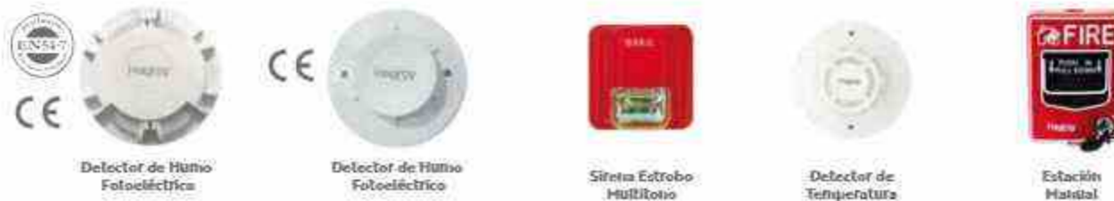
Detector de Humo Fotoeléctrico