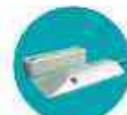
Contacto magnético para puerta/ventana

Te permite usar lo mejor de 2 líneas: Alarma básica y cerros eléctricos. Bajo la protección de un mismo panel centralizado.