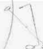
ARO SIMPLE y ARO DOBLE

Alambre para el cerco eléctrico resistente a climas tropicales donde el índice de humedad es extremo.