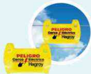
LETRERO DE ADVERTENCIA by Hagroy®

Mide el voltaje del cerco eléctrico con una pantalla digital mostrando el voltaje en KV.