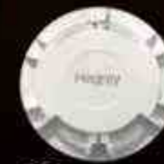
Detector de Humo HG-SDM4/2