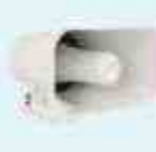
SIRENA DOBLE TONO

Enciende y apaga energizadores a 100m. de distancia en campo abierto.