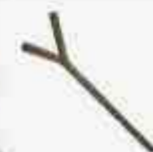
POSTE TEMPLADOR DE 4 HILOS TIPO "Y"

Poste de alta resistencia y con pintura electroestática.