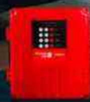
Protoc Fire® 8

*Imágenes de la aplicación referenciales