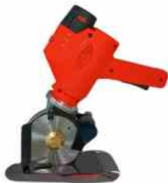
CORTADORA INALAMBRICA DE 4"