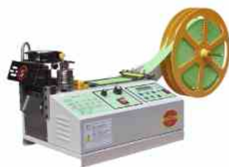
CORTADORA DE TIRAS