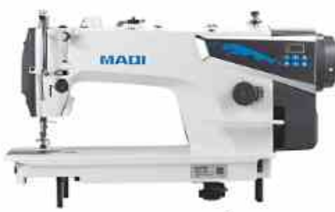
PLANA MECATRÓNICA Q2

Máquina de coser pespunte de accionamiento directo