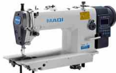
PLANA TRABAJO PESADO LS-202 TD3

Plana electronica gancho grande trabajo pesado