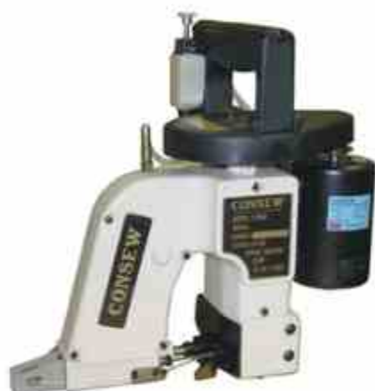
COSEDORA DE LONAS CONSEW USA