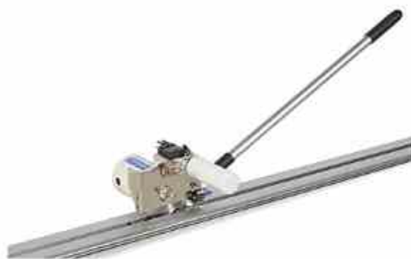
CORTADORA DE EXTREMOS