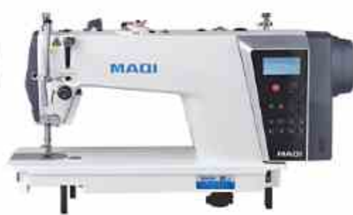
PLANA ELECTRÓNICA Q5TE

Máquina de coser Pespunte con cortahilos automático