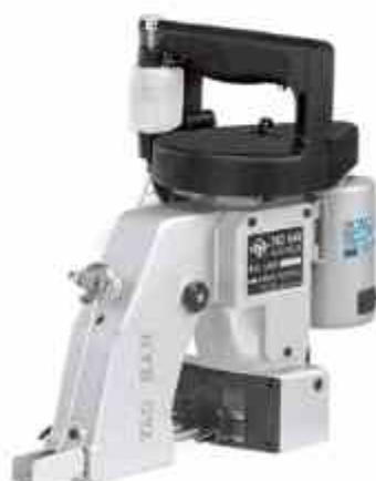
COSEDORA DE LONAS YAO HAN TAIWAN