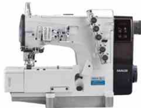
COLLARIN MECATRÓNICA W1C

Máquina de coser overlock computarizada súper rápida.