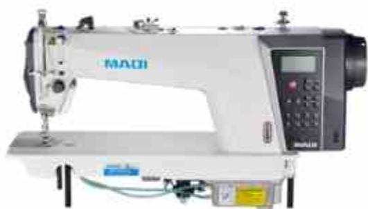
PLANA ELECTRÓNICA Q6LTE

Máquina de coser de pespunte inteligente