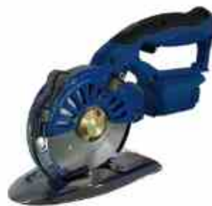
CORTADORA INALAMBRICA DE 4"