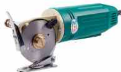
CORTADORA DE 2", 2,5"