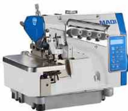
FILETEADORA ELECTRÓNICA X4C

Máquina de coser overlock de accionamiento directo