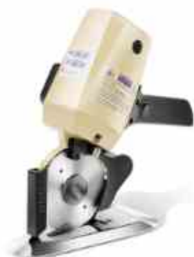
CORTADORA DE 4"