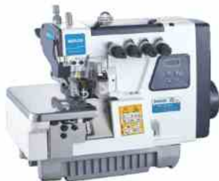
FILETEADORA MECATRÓNICA C1

Plana electronica gancho grande trabajo pesado