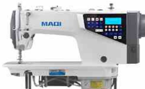
PLANA ELECTRÓNICA Q7T

máquina de coser inteligente de pespunte de gran espacio