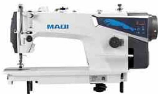
PLANA MECATRÓNICA Q1

Máquina de coser pespunte de accionamiento directo