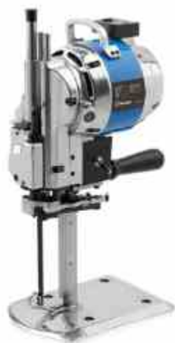
CORTADORA VERTICAL DE 6"- 12"