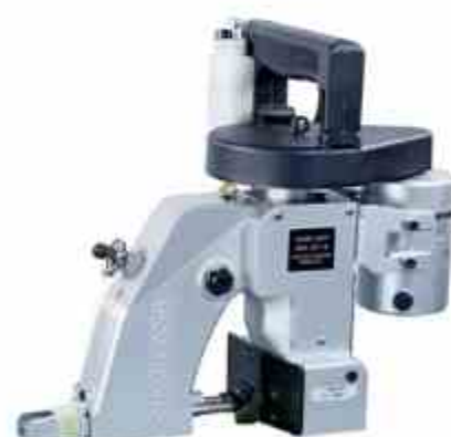
COSEDORA DE LONAS NEW LONG JAPON