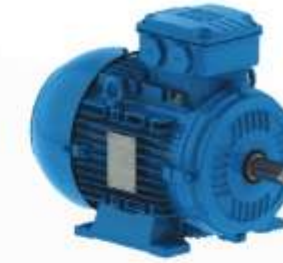
Ventilación centrífuga FC con motor weg IE3 Eficiencia premium o tipo plenum fan con motor EC para mayor eficiencia.