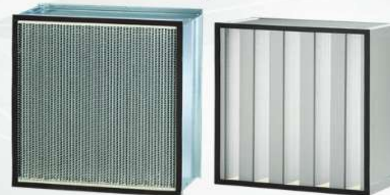
Los filtros Hepa (High Efficiency Particulate Air filter) para el filtrado de hasta el 99,99% de las partículas.