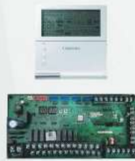
Kit de alta eficiencia para el ahorro de energía (opcional).