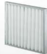
Filtro merv 11 (65%) y merv 15 (95%) captan partículas entre 1-3 micrones.