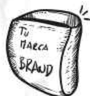
MARCA PROPIA PRIVATE LABEL