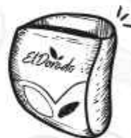
MARCA EL DORADO EL DORADO BRAND