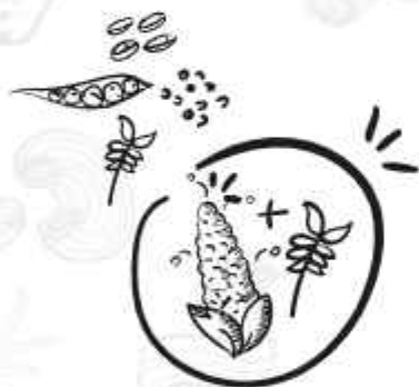
INGREDIENTES NATURALES NATURAL INGREDIENTS