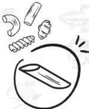
DIFERENTES FORMATOS DIFFERENT TYPES