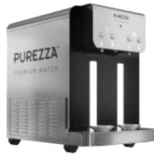
P2 Firewall™ Bar Classe