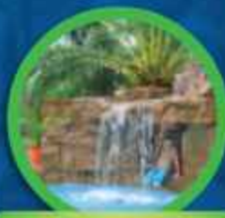
PISCINAS DE GRUTA NATURAL