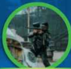
JUEGOS DE CAMPO ABIERTO