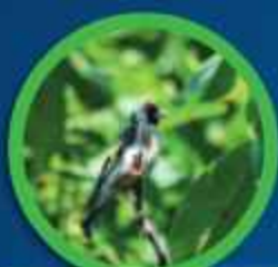
AVISTAMIENTO DE AVES

En el Proyecto Agroindustrial Edén tendremos cubiertos varios sectores del turismo como: