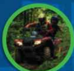
CUATRIMOTOS - AVENTURAS SOBRE RUEDAS