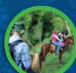
RECORRIDOS A CABALLO

Acompañados por estaciones de interacción con animales de granja.