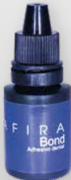
ZAFIRA BOND 8 ml

Resina compuesta fotopolimerizable con Nano Smart Position (Distribución Inteligente de Nanopartículas de Sílica) logra resultados ideales de estética y función.