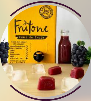
G r a p e

Es una fuente de antioxidantes, son sustancias naturales que pueden prevenir o retrasar algunos tipos de daños a las células. Contiene cierta cantidad de glucosa y fructosa.