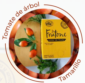
Tomate de árbol