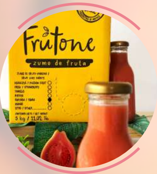
G u a v a

Posee propiedades astringentes, antiespasmódicas y antimicrobianas, es rica en fibras solubles como la pectina y rica en vitamina C, También contiene un componente llamado ácido arjunolico.