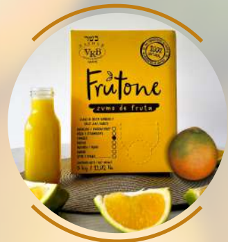
T a n g e l o

It contains B vitamins and is rich in vitamin C. It is very diuretic, which helps fight fluid retention in the body. It has astringent, antispasmodic and antimicrobial properties.