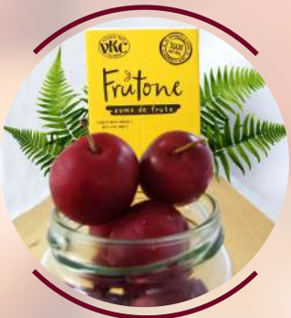
P l u m C i r u e l a

La ciruela es rica en agua y en tiamina B1, pues cuenta con un porcentaje alto, esto la convierte en un alimento energético, alcalinizante, depurativo, refrescante, ligero y tonificante, capaz de estimular el sistema nervioso y combatir la fatiga. The plum is rich in water and in tiamina B1, because it has a high percentage, this makes it an energetic food, alkalizing, purifying, refreshing, light and toning, able to stimulate the nervous system and combat fatigue.