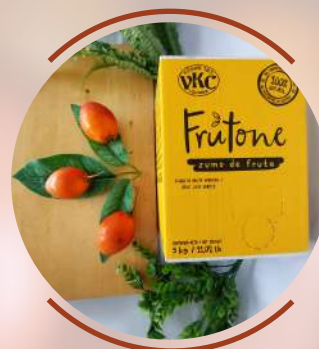
T o m a t e d e á r b o l o T a m a r i l l o

Being a fruit rich in magnesium, it can help control some cardiovascular risk factors such as high blood pressure, obesity, insulin resistance or elevated cholesterol.