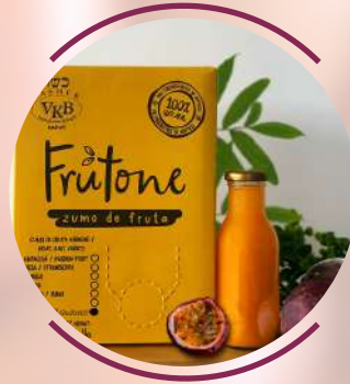
Red Passion Fruit Guava

Apoya los tratamientos para la artritis degenerativa debido a sus propiedades antiinflamatorias y analgésicas, antioxidantes presentes. Contiene vitamina C y complejo B. It supports treatments for degenerative arthritis due to its anti-inflammatory and analgesic properties, antioxidants present. Contains vitamin C and B complex