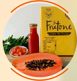
P a p a y a

It is rich in penile lico, which has antioxidant effect, covering 25% of the recommended daily amount for an average adult. Fiber helps improve intestinal transit time, improving constipation.