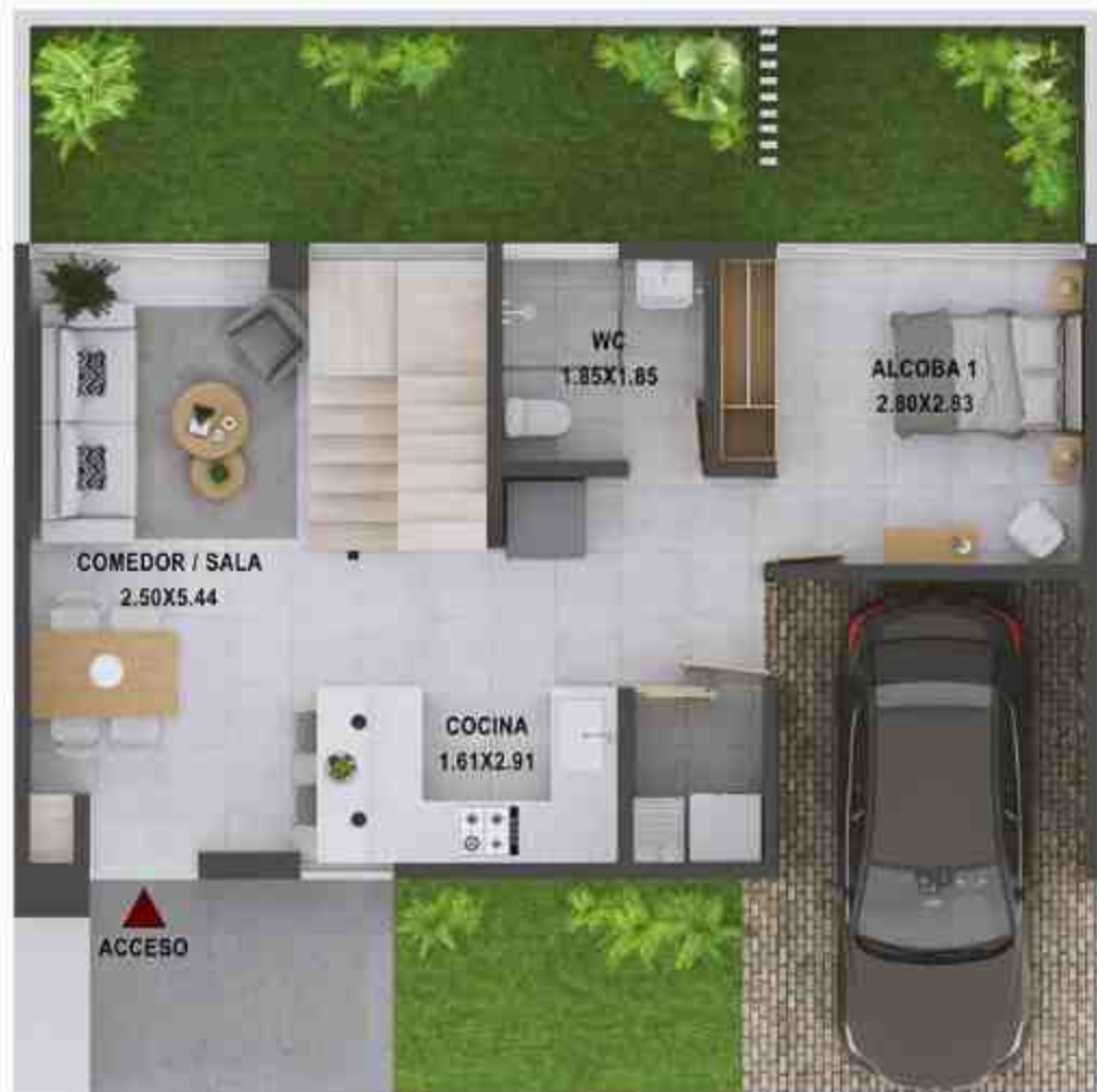
PLANO CASA BORA PISO 1