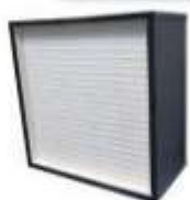
FILTRO HEPA 99.99%