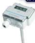
TRANSMISOR DE VELOCIDAD