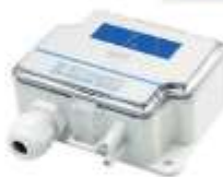
TRANSMISOR DE PRESIÓN