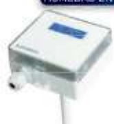
TRANSMISOR HUMEDAD EN DUCTO