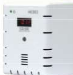
DETECTOR DE DIÓXIDO DE CARBONO