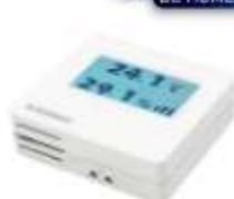
TRANSMISOR DE HUMEDAD