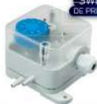
SWITCH DE PRESIÓN