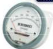
MANÓMETRO PARA FILTRO