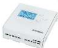
RH TEMPERATURA Y PM