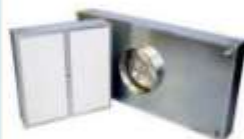
MÓDULO TERMINAL TRI PURE