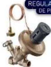
REGULADORA DE PRESIÓN