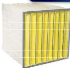
FILTRO DE BOLSA