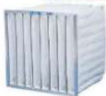
FILTROS DE BOLSAS