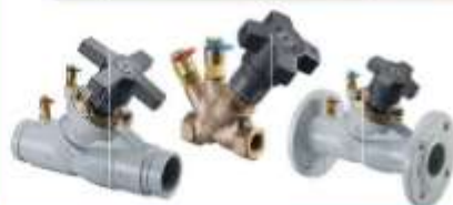
REGULACIÓN Y EQUILIBRIO MANUAL