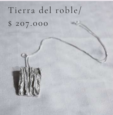
Tierra del roble/