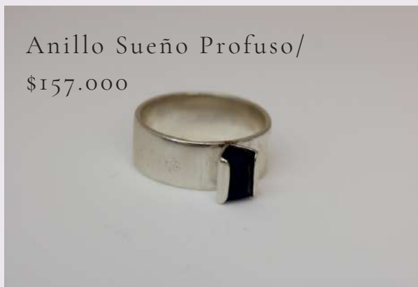
Anillo Sueño Profuso/ $157.000