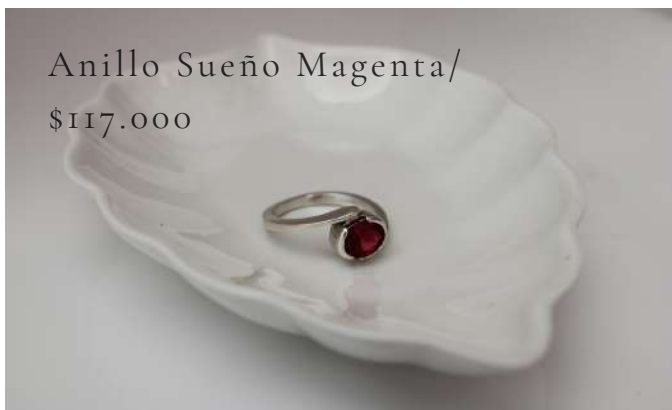
Anillo Sueño Magenta/ $117.000