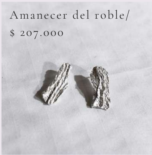
Amanecer del roble/ $ 207.000