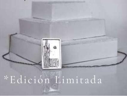
Ciudad del bosque/ $ 217.000