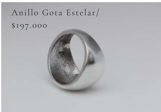
Anillo Gota Estelar/ $197.000