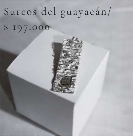
Surcos del guayacán/