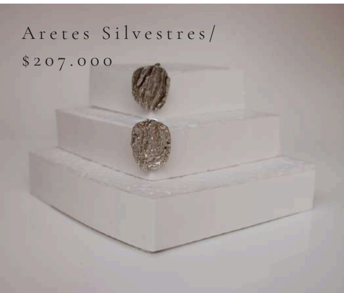
Aretes Silvestres/ $207.000