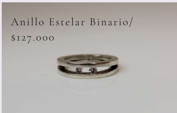
Anillo Estelar Binario/ $127.000