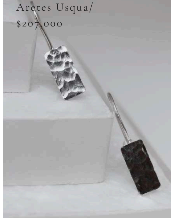
Aretes Usqua/ $207.000