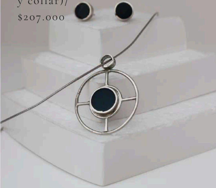
Conjunto Mar Profundo (aretes y collar)/ $207.000