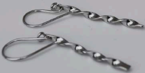
Aretes Bucle del Mar/ $157.000