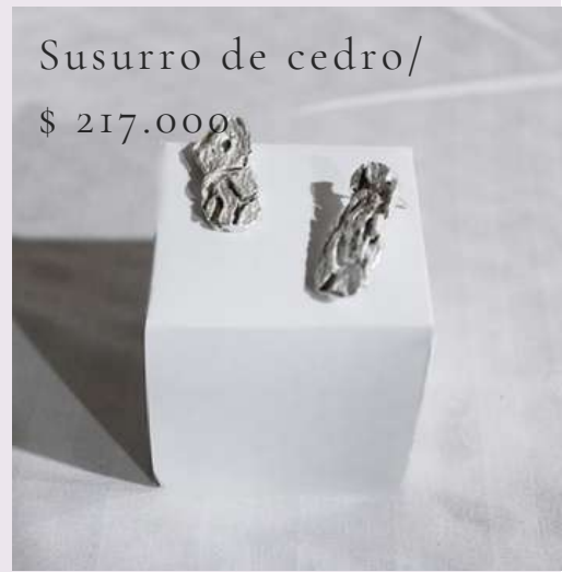
Susurro de cedro/ $ 217.000