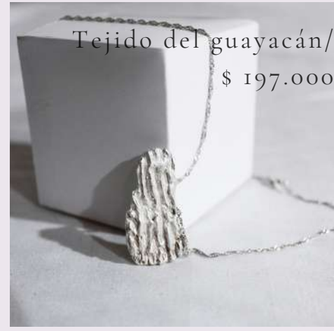
Tejido del guayacán/