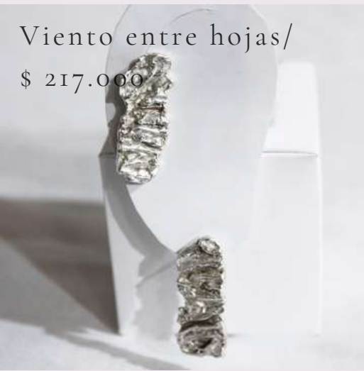
Viento entre hojas/ $ 217.000