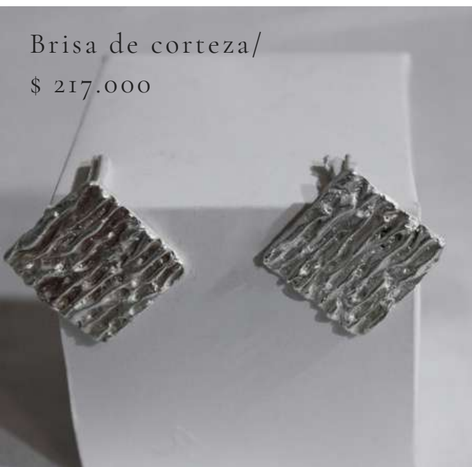
Brisa de corteza/ $ 217.000