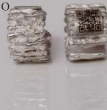
Earcuff Grietas/ $ 167.000