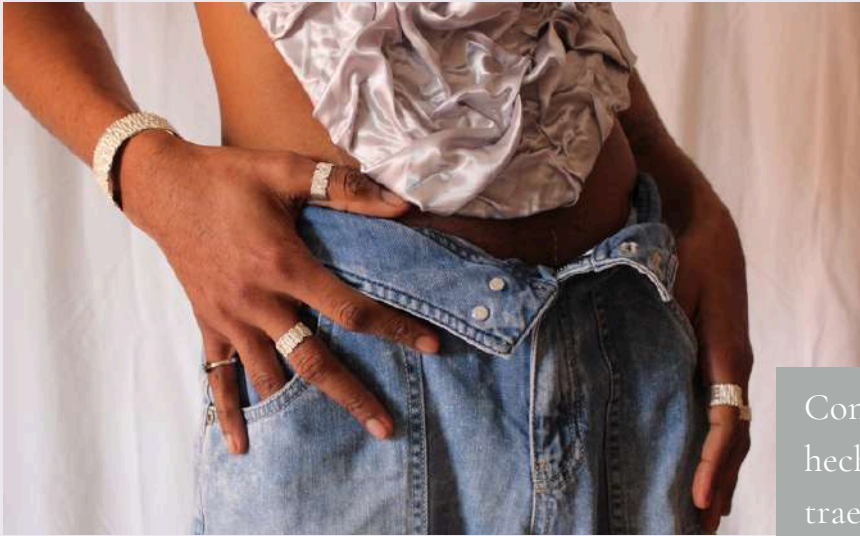
Anillo Sombra del Bosque/ $ 177.000