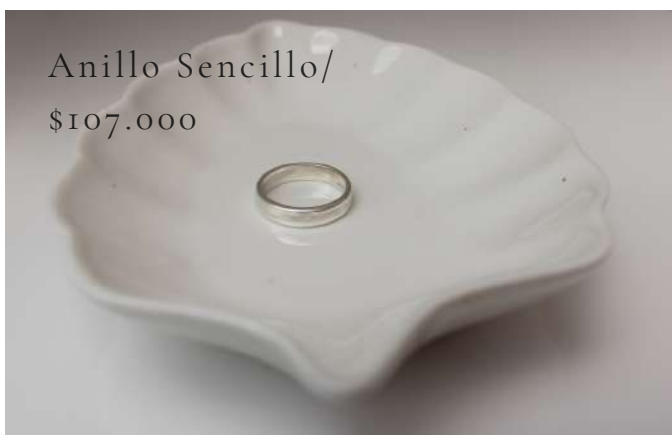
Anillo Sencillo/ $107.000