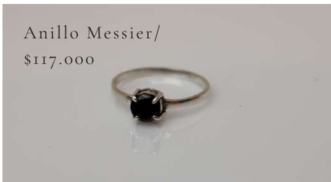
Anillo Messier/ $117.000