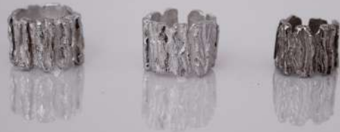
Earcuff Llave del Bosque/ $ 167.000