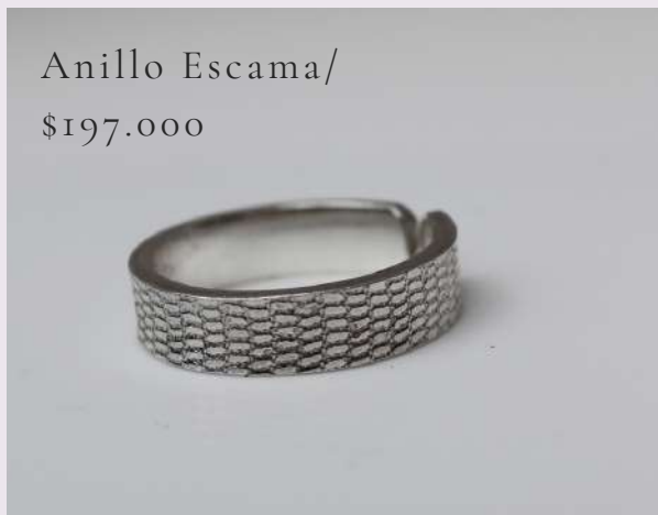
Anillo Escama/ $197.000