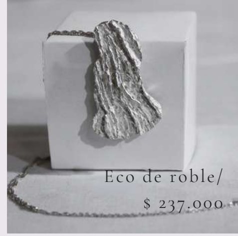
Eco de roble/