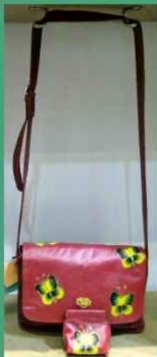
MCQ24 Bolso Linea Escuela