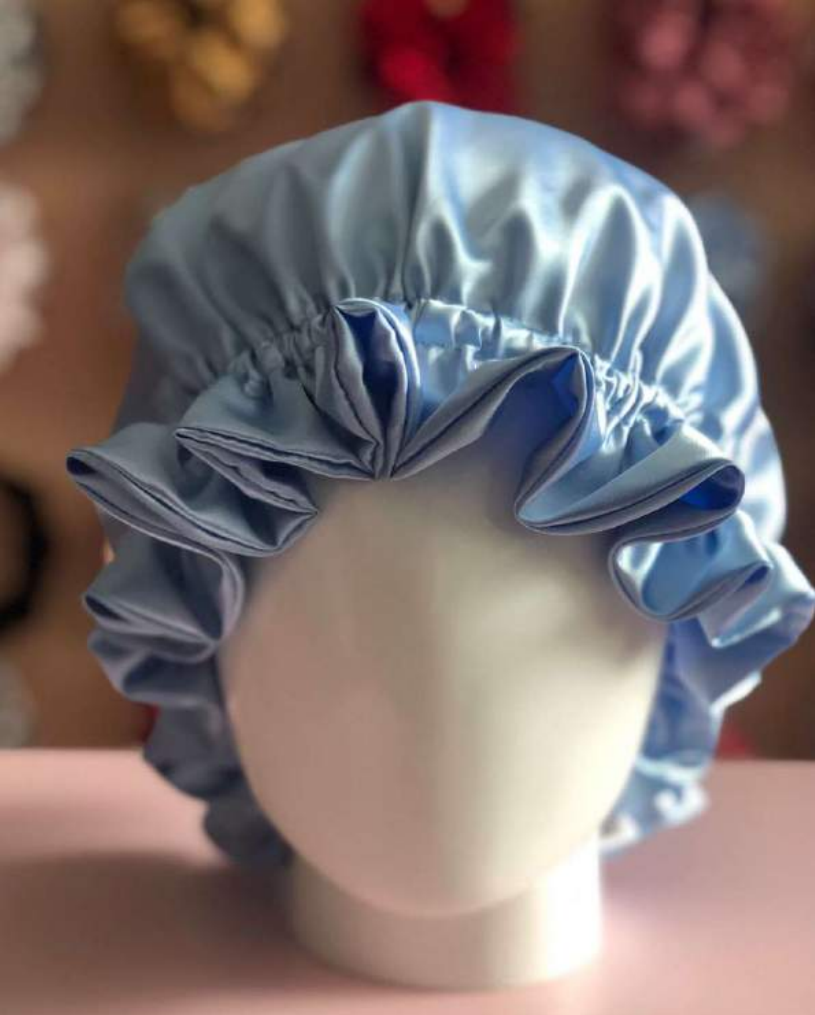
AZUL CIELO UNICOLOR