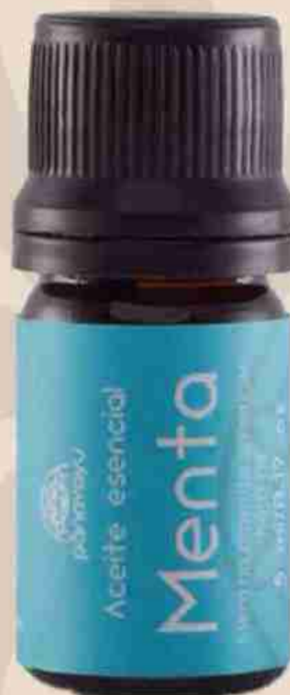
ACEITE ESENCIAL DE MENTA