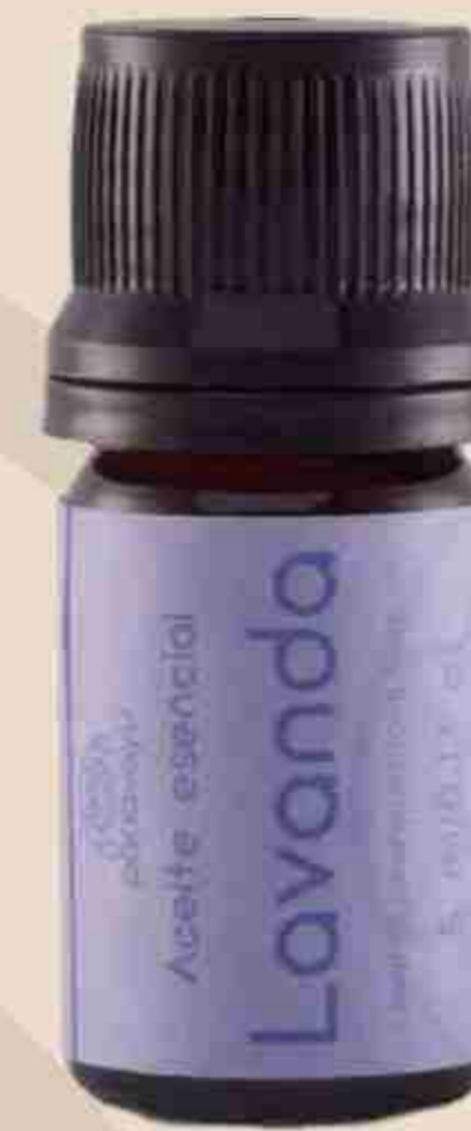
ACEITE ESENCIAL DE LAVANDA