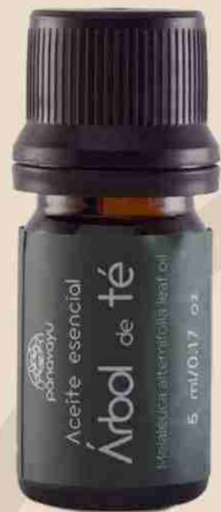
ACEITE ESENCIAL ÁRBOL DE TÉ