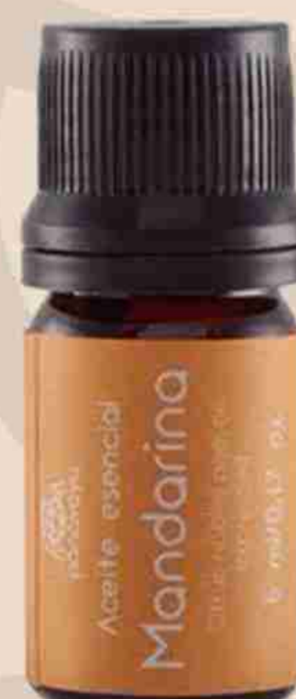
ACEITE ESENCIAL DE MANDARINA