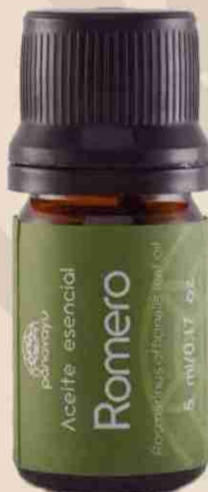
ACEITE ESENCIAL DE ROMERO