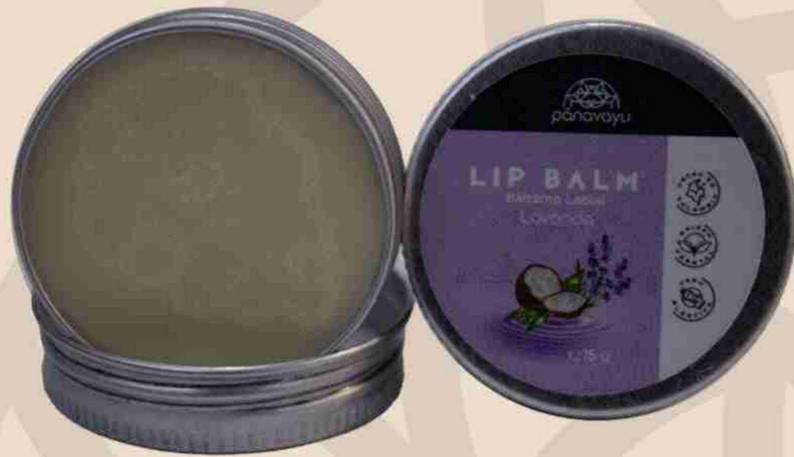
Bálsamo de Labios de lavanda