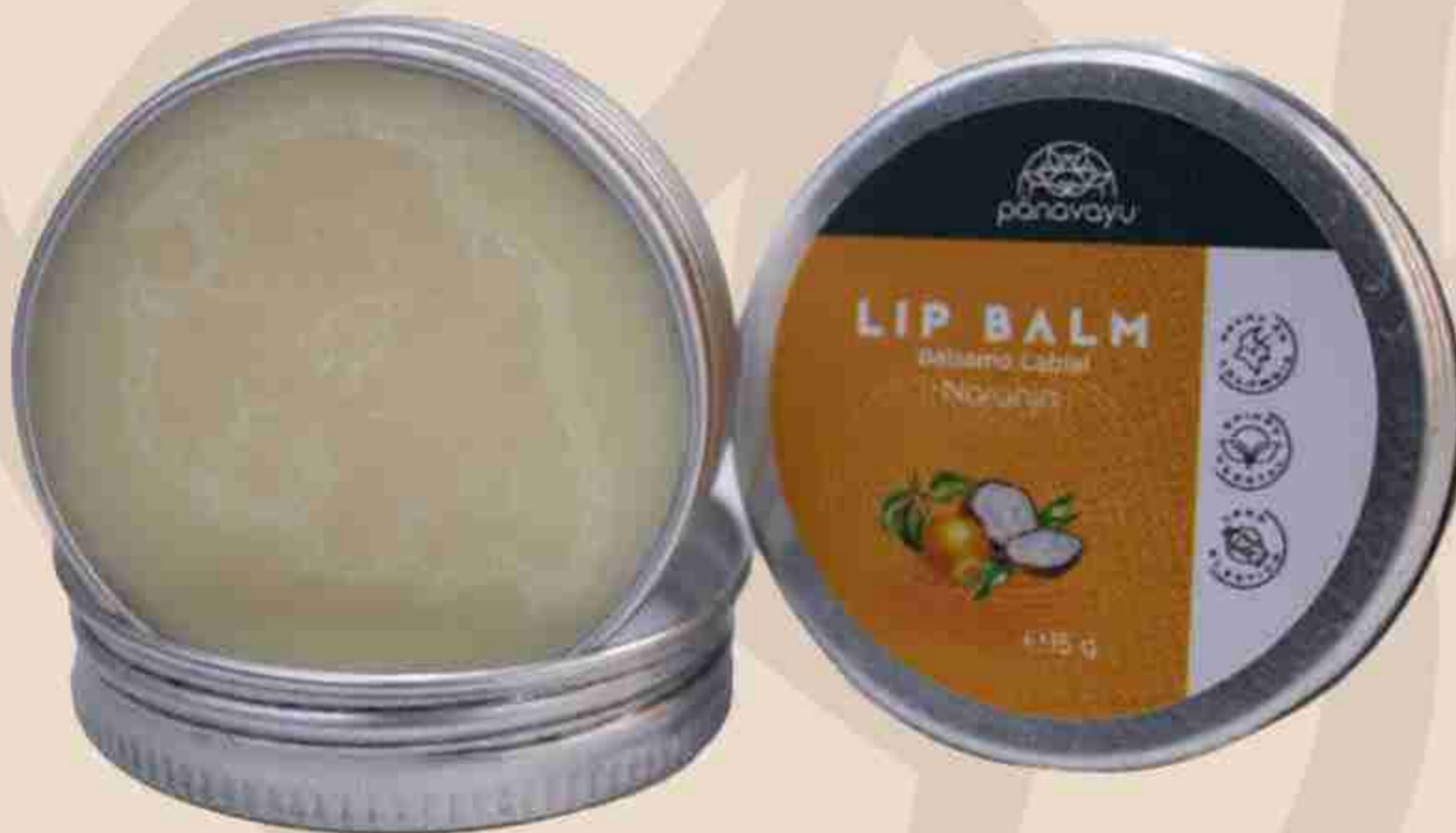
Bálsamo de Labios de Mandarina y Naranja