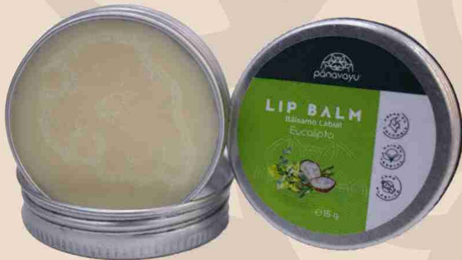
Bálsamo de Labios de Eucalipto