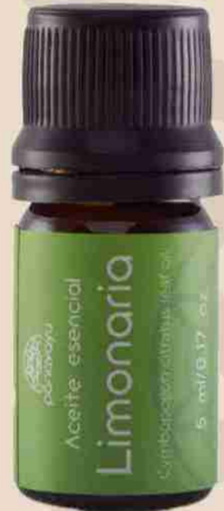
ACEITE ESENCIAL DE LIMONARIA