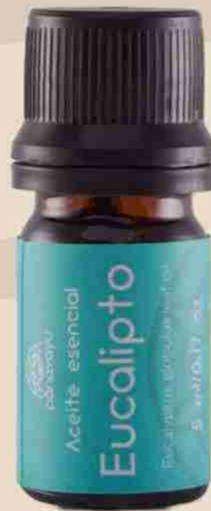
ACEITE ESENCIAL DE EUCALIPTO