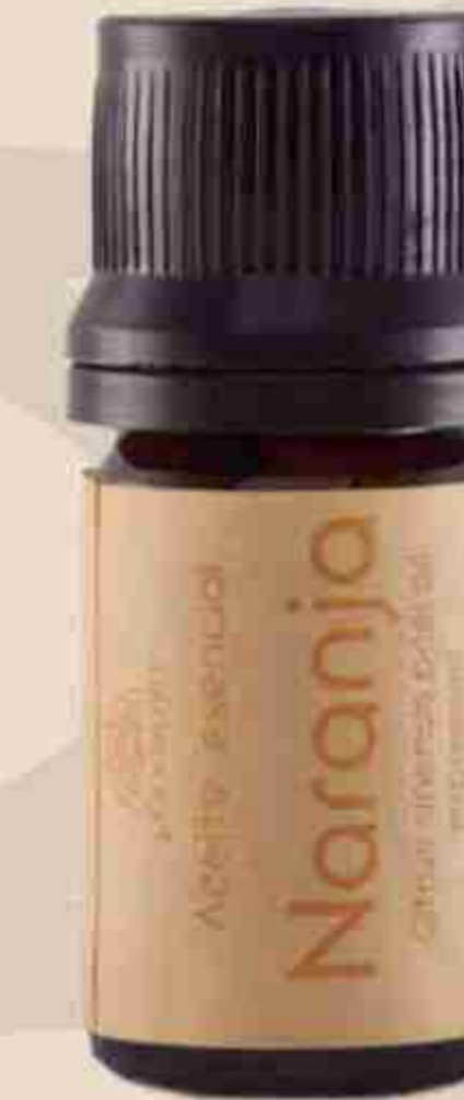
ACEITE ESENCIAL DE NARANJA